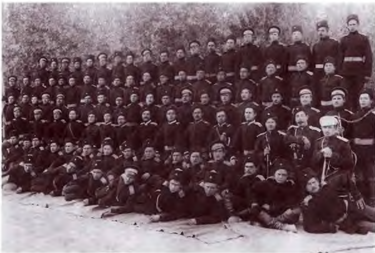
4-я сотня 5-го Оренбургского казачьего полка. Ташкент. Конец XIX в.