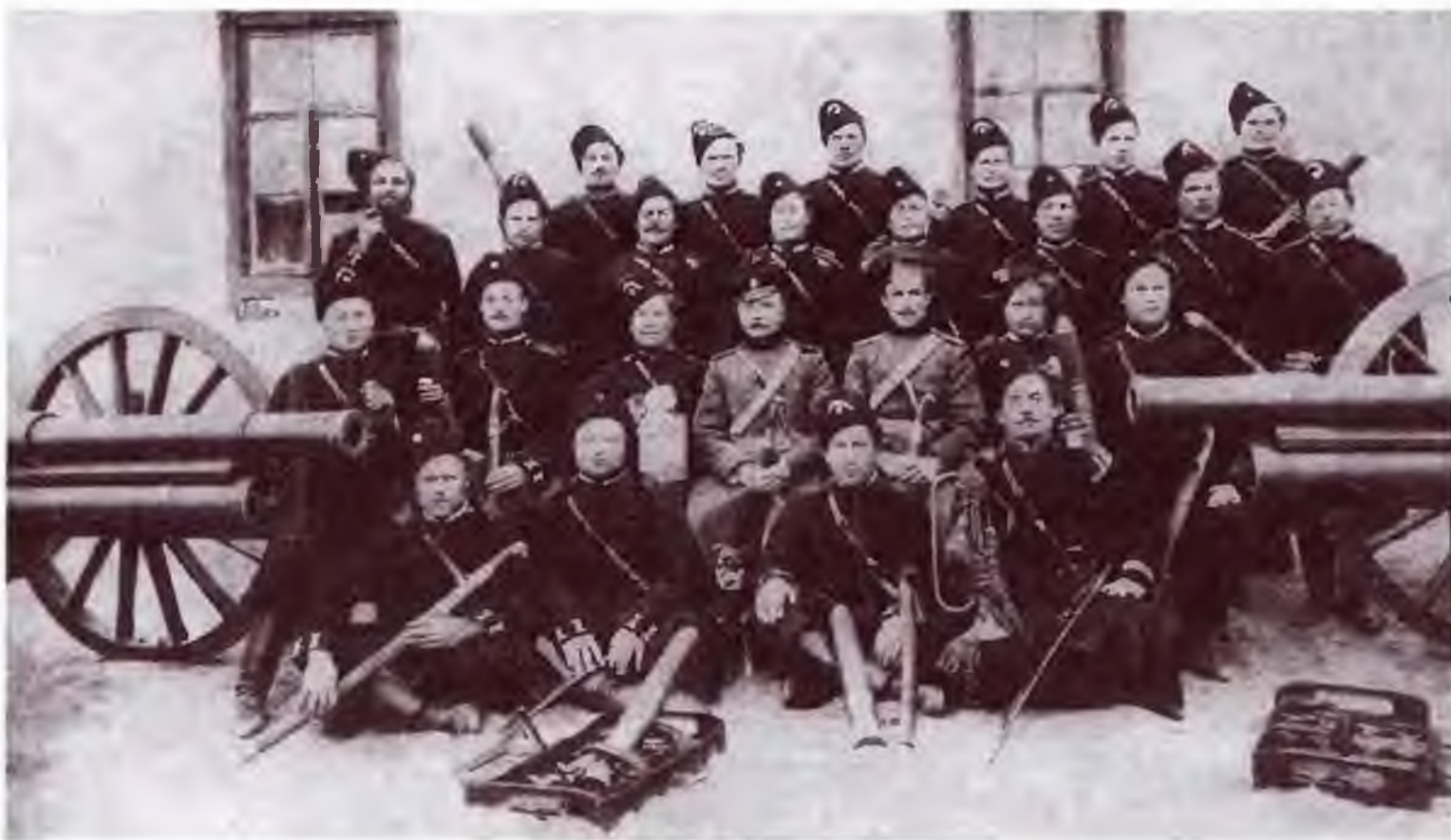
1-я Оренбургская казачья батарея. Конец XIX в.