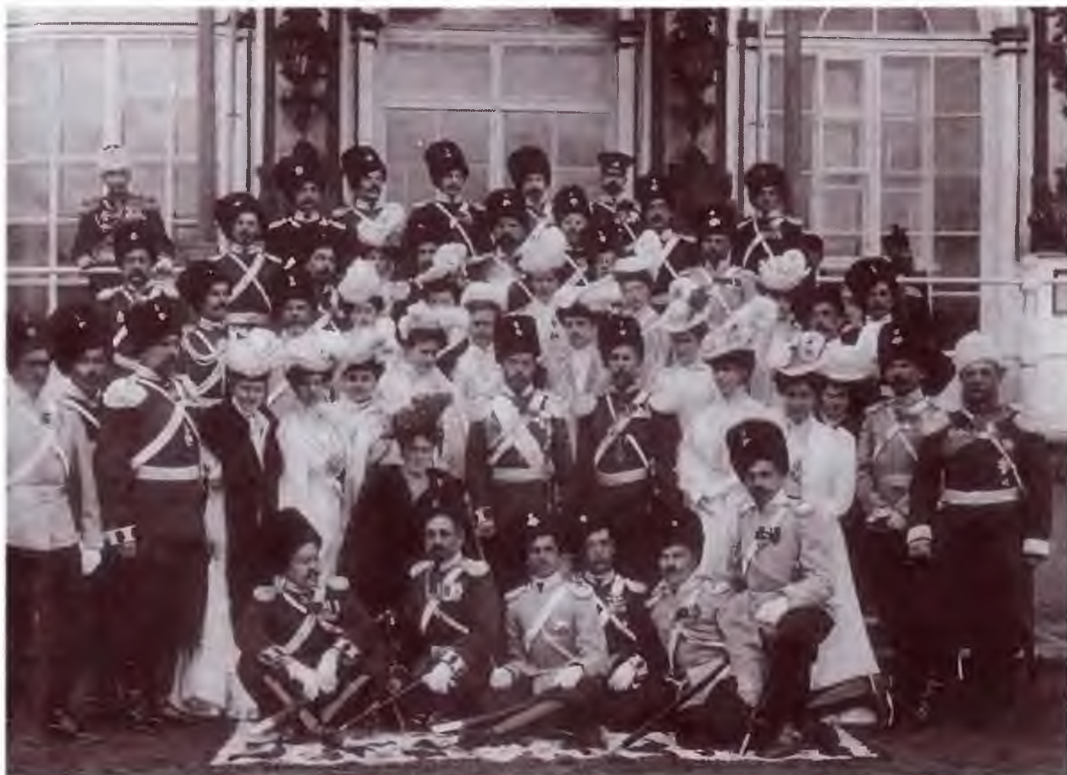
Император Николай II, императрица Александра Федоровна на празднике Лейб-гвардии Сводно-казачьего полка. 6 апреля 1907 г. ( Часовые отечества . Из истории российского казачества. Каталог выставки. СПб., 2006)