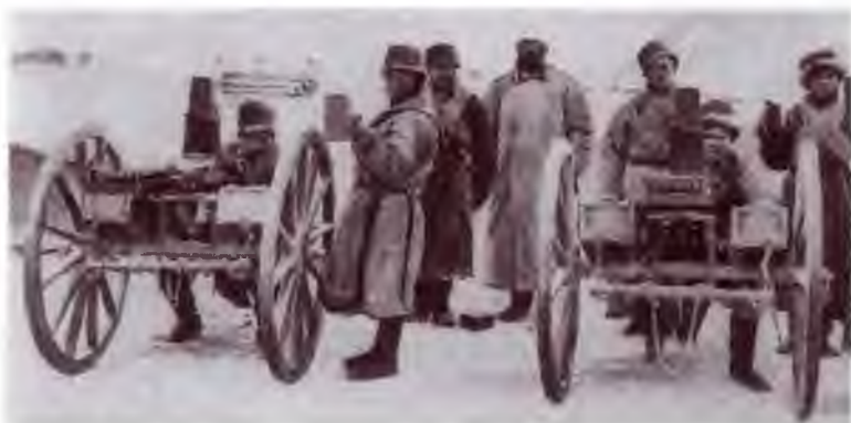
Казаки отряда полковника М.Е. Ионова на Памире с картечными Гатлинга. 1890-е гг.