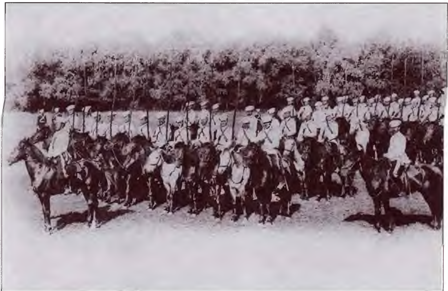
1-й Оренбургский казачий полк. Открытка. Конец XIX в.