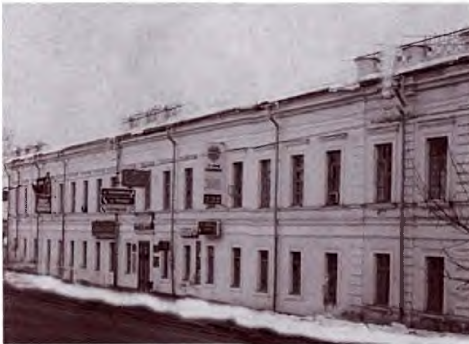
Войсковое хозяйственное правление Оренбургского казачьего войска. Оренбург.