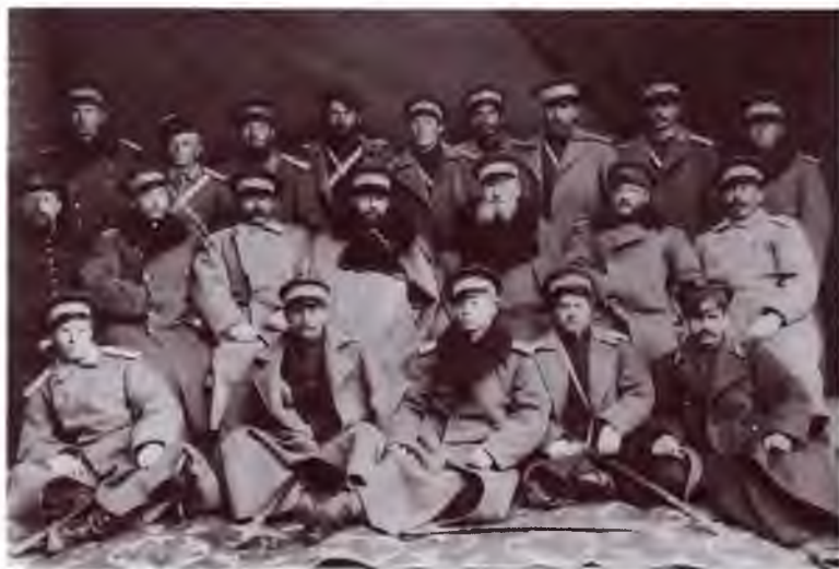
Группа офицеров одного из Оренбургских казачьих полков. Конец XIX в.