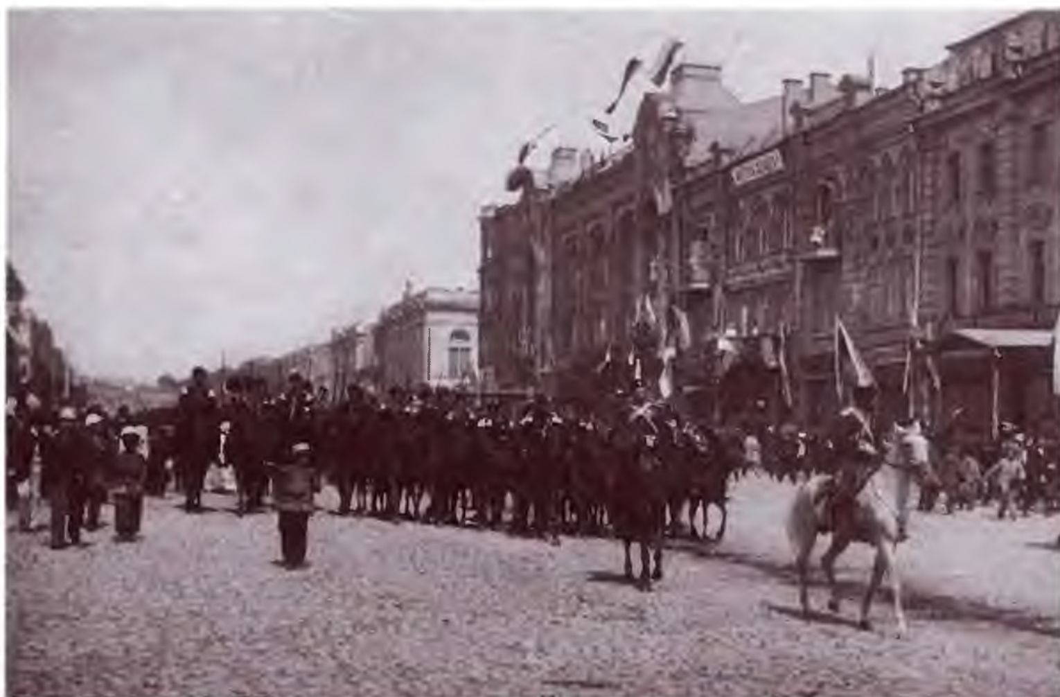
Оренбургские казаки на Крещатике. Киев. 1888 г. Публикуется впервые