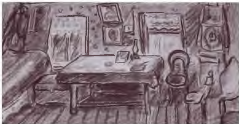
Горница казачьей избы станицы Кардаиловской. Рис. В.Г. Бешенцева Публикуется впервые