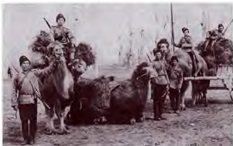
Оренбургские казаки с верблюдами. Туркестан. Конец XIX—начало XX в.