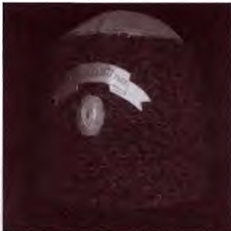
Папаха оренбургского казака. Начало XX в. Частная коллекция