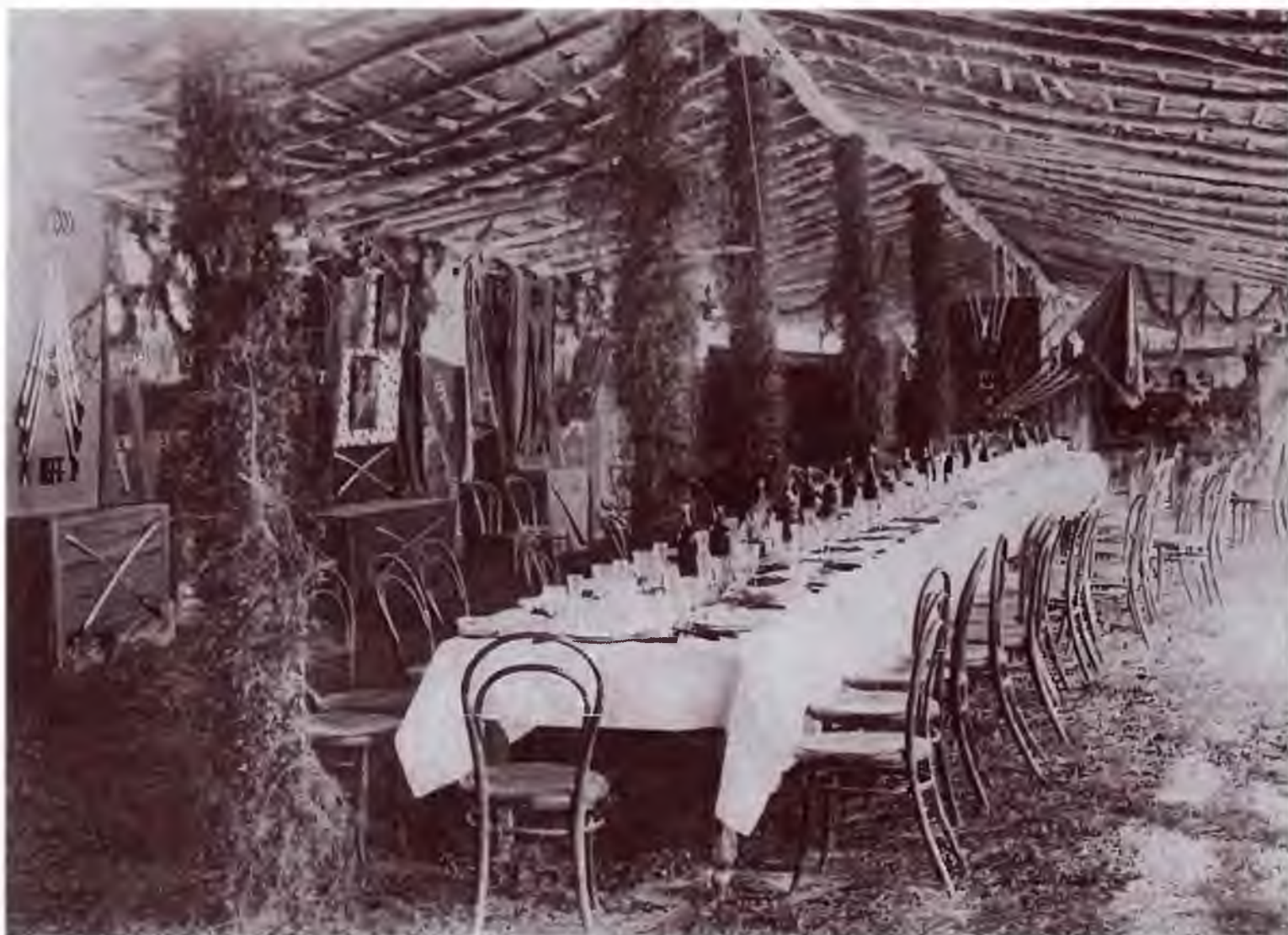
Офицерская столовая 5-го Оренбургского казачьего полка в день полкового праздника. Конец XIX в. Оренбургский областной краеведческий музей.