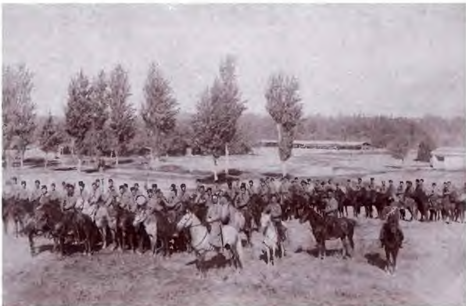
1-я сотня 5-го Оренбургского казачьего полка. Конец XIX в. Оренбургский областной краеведческий музей. Фото предоставлено В.Г. Семеновым. Публикуется впервые