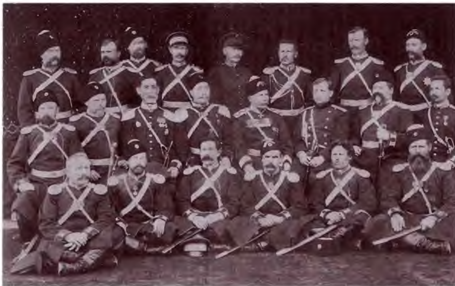
Группа старших офицеров Оренбургского казачьего войска. Конец XIX в. Оренбургский областной краеведческий музей