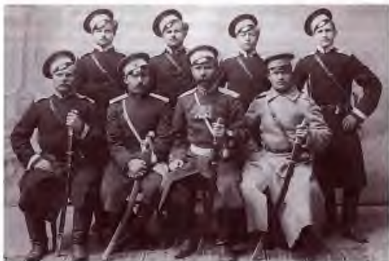
Казачи 3-го военного отдела Оренбургского казачьего войска. Троицкий краеведческий музей.