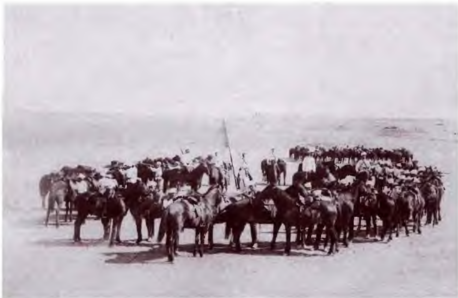
4-я сотня 5-го Оренбургского казачьего полка. Конец XIX в. Оренбургский областной краеведческий музей. Фото предоставлено В.Г. Семеновым. Публикуется впервые