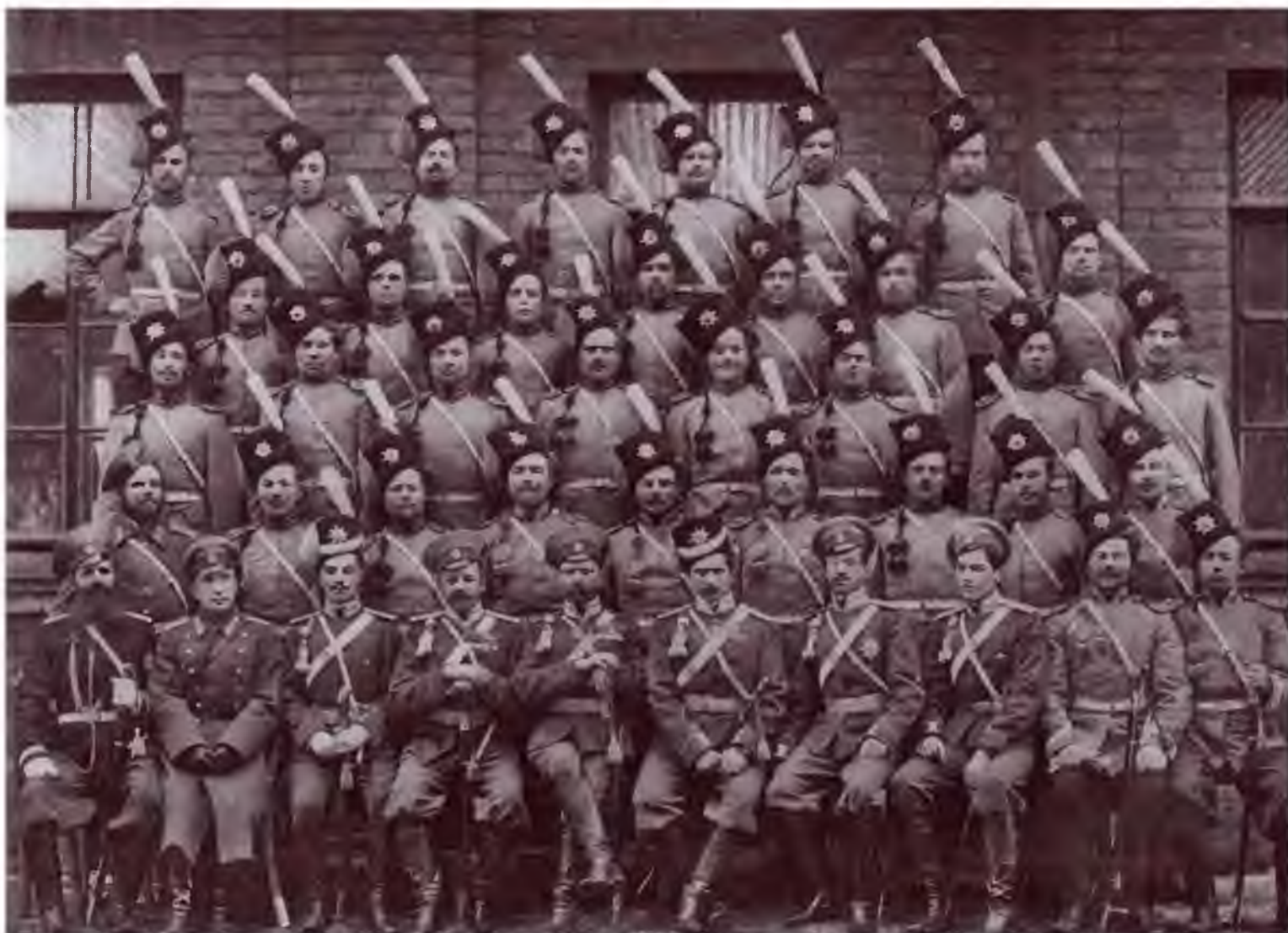
Чины 2-й (оренбургской) сотни Лейб-гвардии Сводно-казачьего полка в парадной форме.