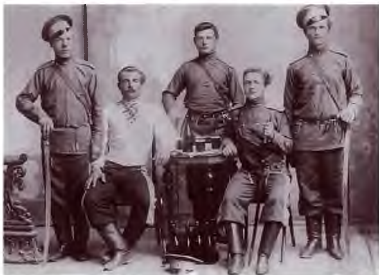
Казаки 3-го Оренбургского казачьего полка. Начало XX в. Публикуется впервые. Обратите внимание на бутылку и стаканы в центре фотографии