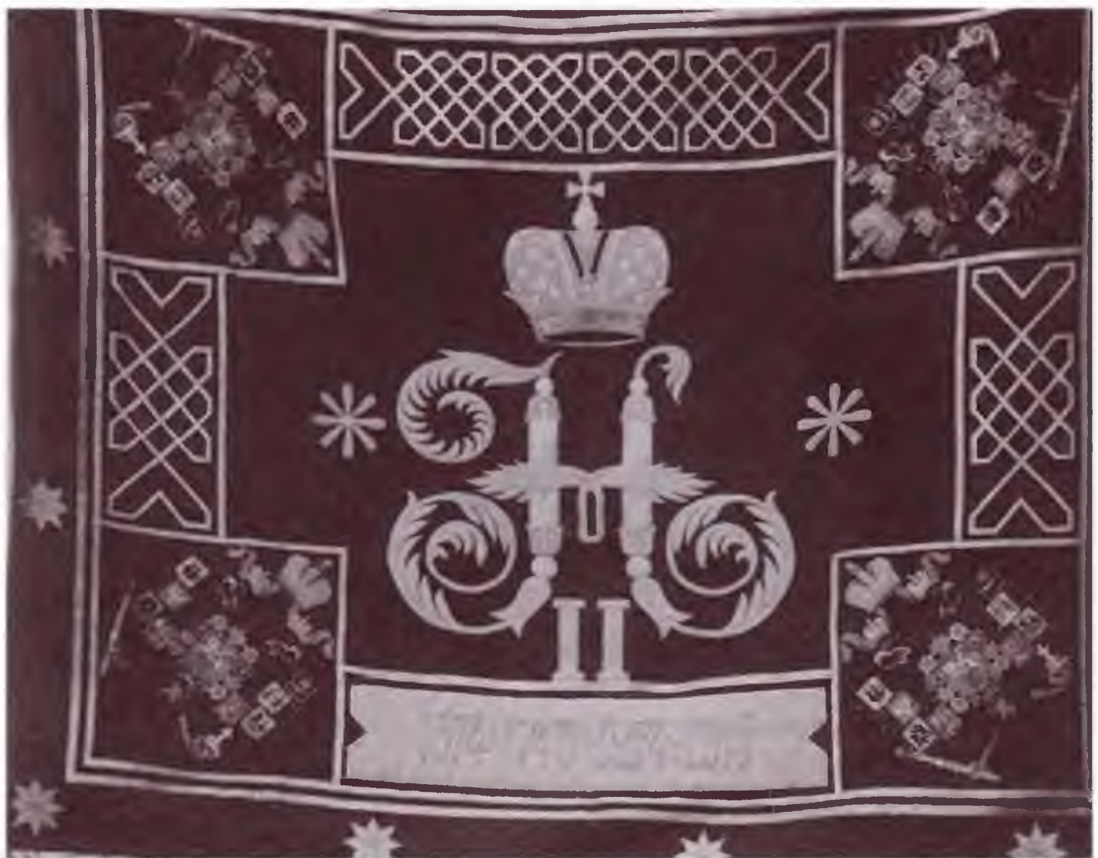
Знамя 2-го Оренбургского казачьего полка. Военно-исторический музей артиллерии, инженерных войск и войск связи.