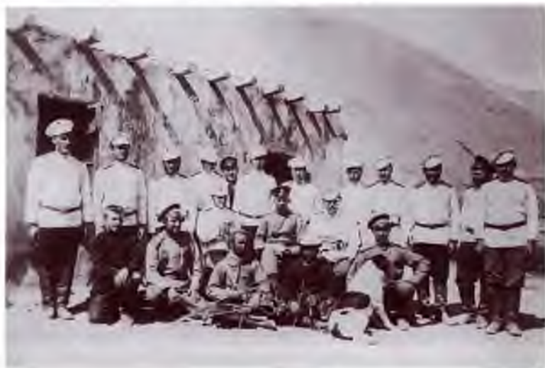
Оренбуржцы на Памире. Публикуется впервые