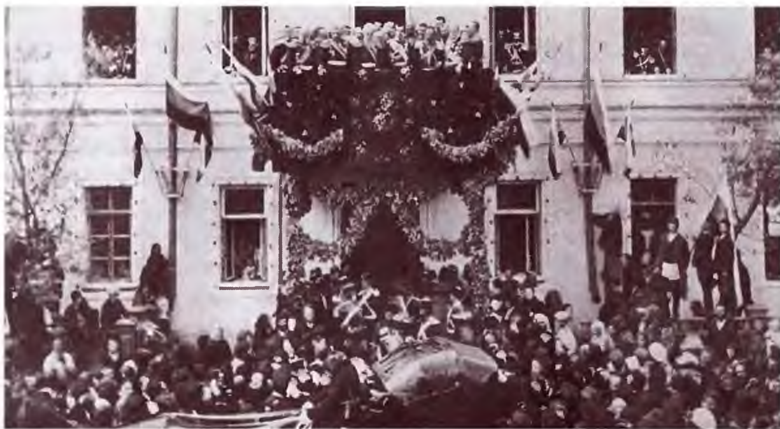
Приезд Наследника цесаревича Николая Александровича в Оренбург. Возле здания Войскового хозяйственного правления на Неплюевской улице. 1891 г.