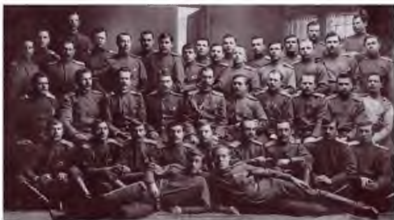
Офицеры и казаки 3-го Оренбургского казачьего полка. Троицк, 1903 г.