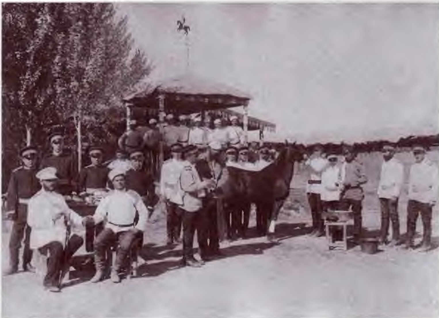
Ветеринарный врач 5-го Оренбургского казачьего полка на практике. Конец XIX в. Оренбургский областной краеведческий музей. Фото предоставлено В.Г. Семеновым. Публикуется впервые