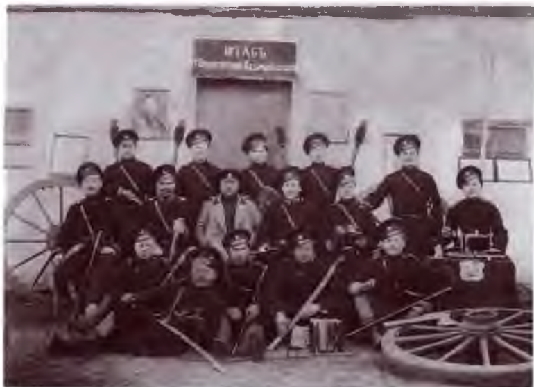
Чины штаба 3-й Оренбургской казачьей батареи. 14 ноября 1898 г. Публикуется впервые