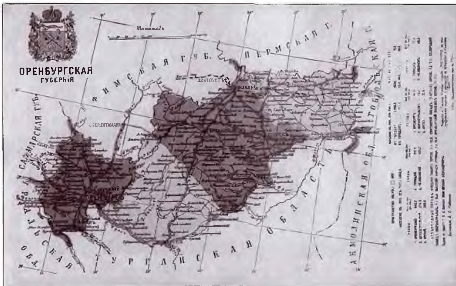
Карта Оренбургской губернии. Начало XX в. Открытка.