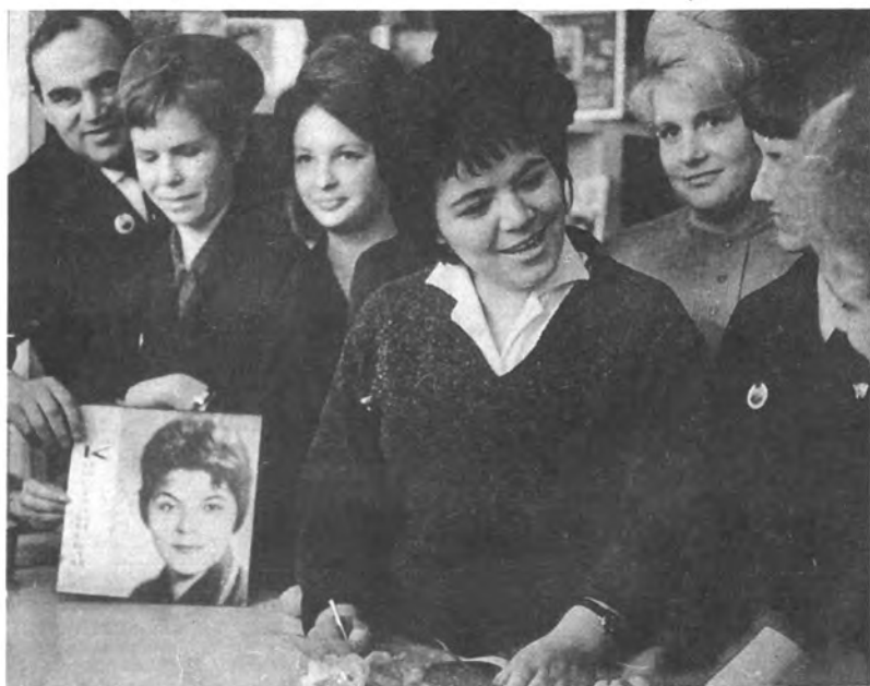
Встреча со слушателями