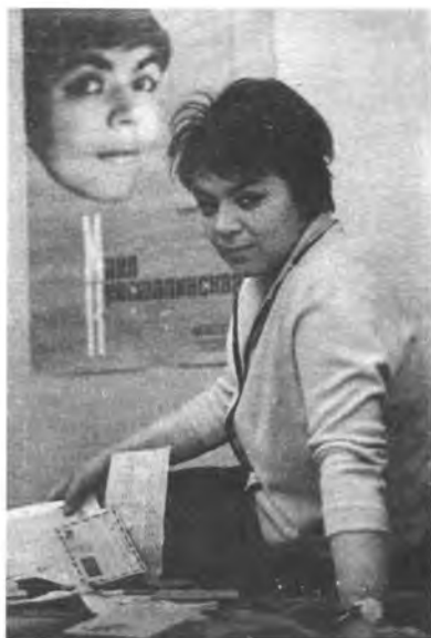
Дома за чтением писем. Начало 70-х