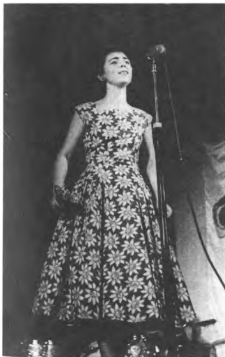
На концерте перед Всемирным фестивалем молодежи и студентов в Москве. 1957 г.