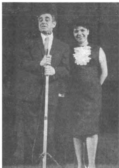
С Аркадием Островским. 1960 г.