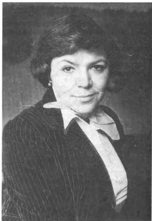
Майя Кристалинская. На- чало 80-х