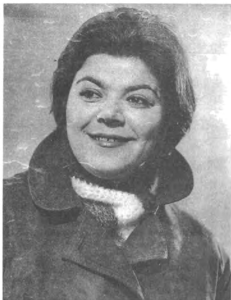
Майя Кристалинская. Конец 70-х