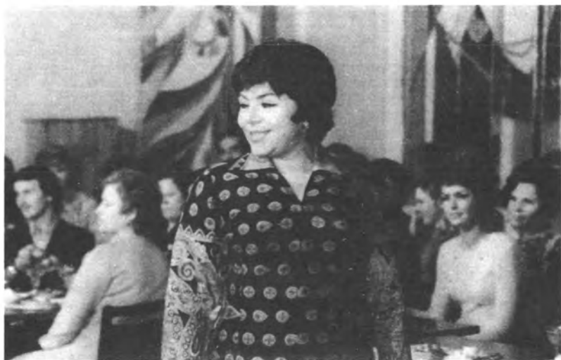
На «Голубом огоньке». Конец 60-х