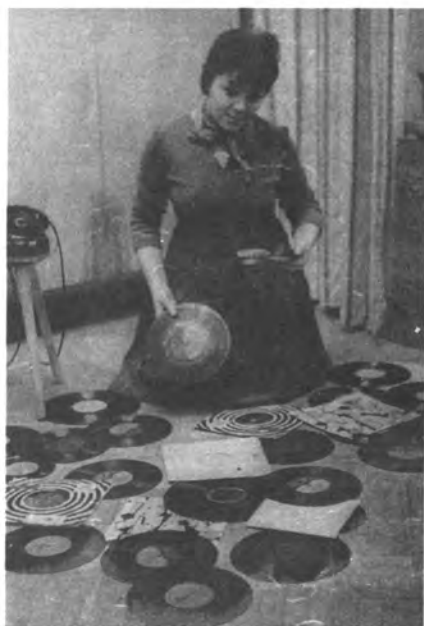
Майя Кристалинская. 1962 г.