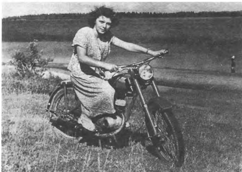
На каникулах в Подмоскowie. Начало 50-х годов