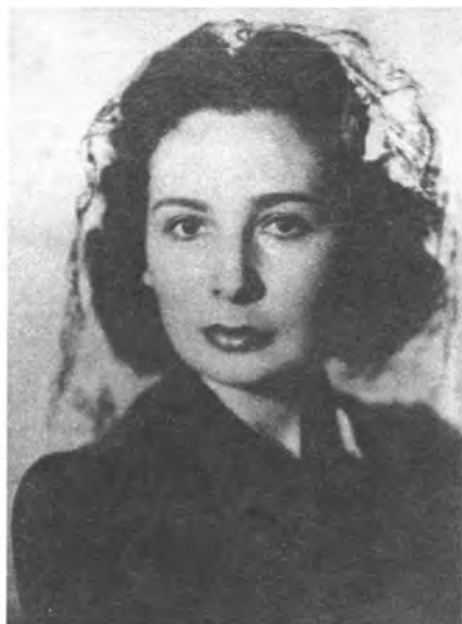
Раиса Ильинична Кристалинская