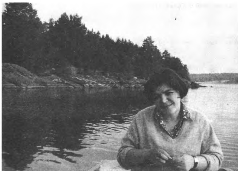
Вязание — любимое занятие. На отдыхе в Серебряном Бору. Начало 70-х