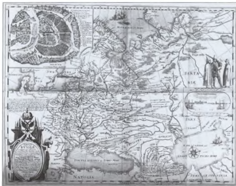
Карта России, составленная Федором Годуновым, изданная Г. Герритсом в Амстердаме