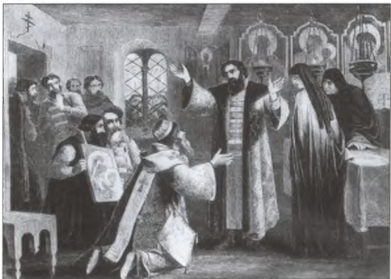
Борис Годунов принимает царский сан. Художник А. Нидерман