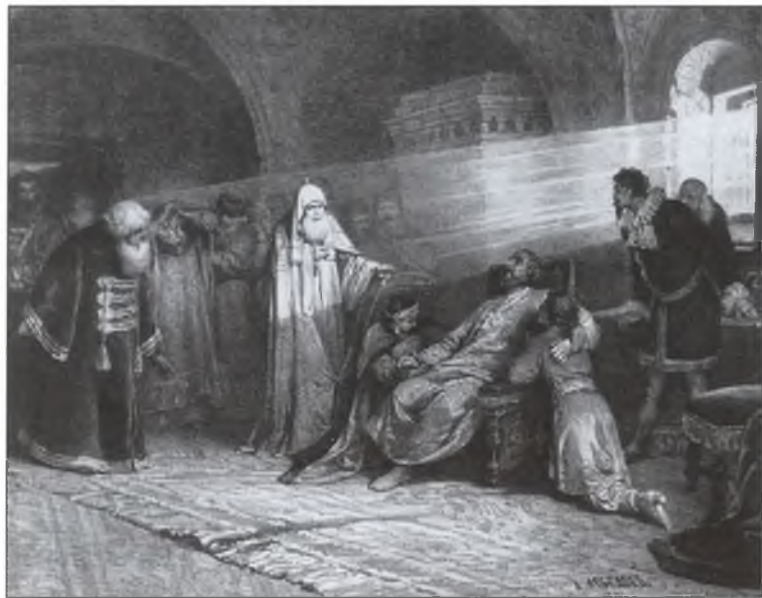
Смерть Бориса Годунова. Художник К.В. Лебедев