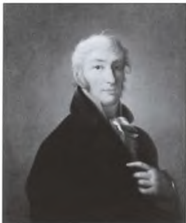
Н.М. Карамзин. Художник Дж.-Б. Дамон-Ортолани