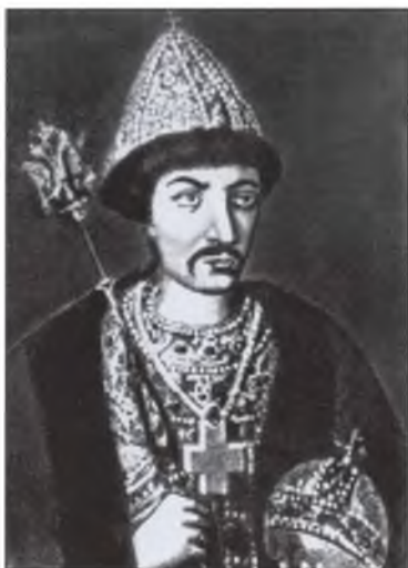
Царь Борис Годунов. Неизвестный художник