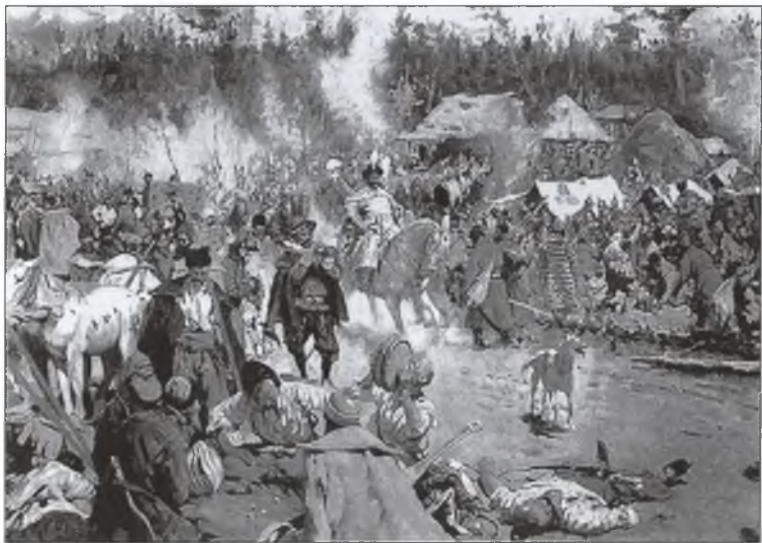
В Смутное время. Художник С.В. Иванов