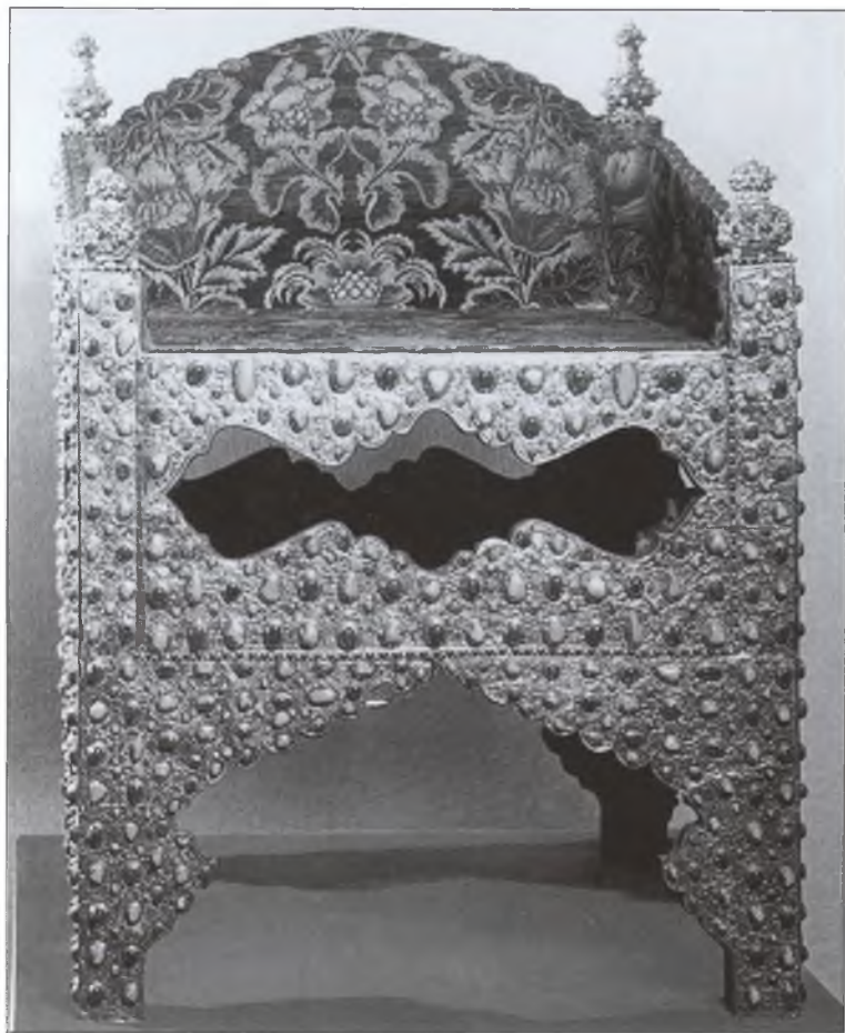
Трон царя Бориса Годунова. Дар персидского шаха Аббаса I Борису Годунову в 1604 г.