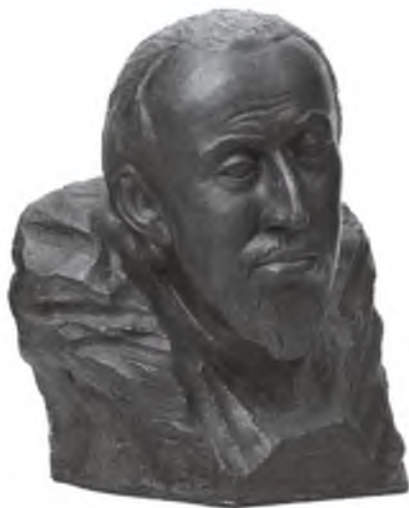
Царь Федор Иоаннович. Антропологическая реконструкция