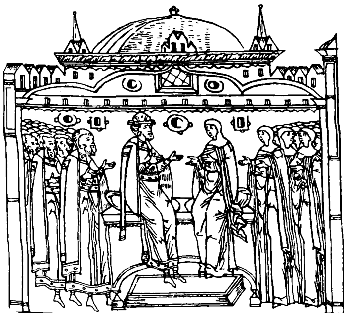
Борис Годунов и его сестра Ирина. Из «Жития митрополита Алексия»