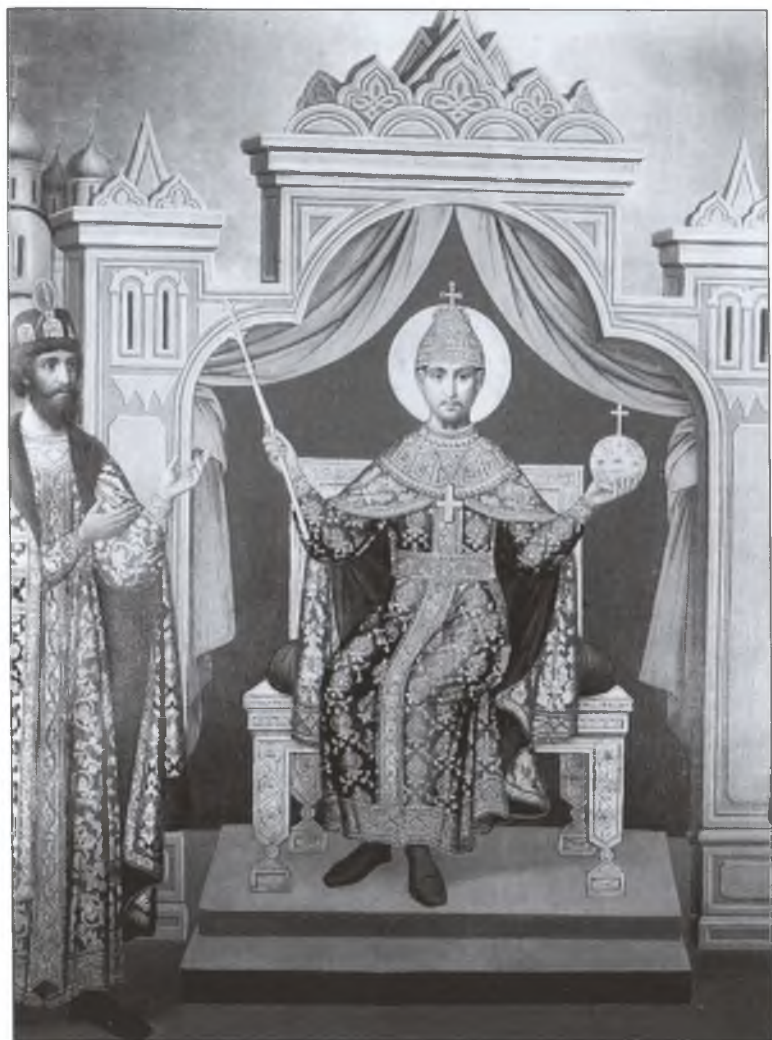
Царь Федор и Борис Годунов. Стенопись. Грановитая палата. Кремль. Москва