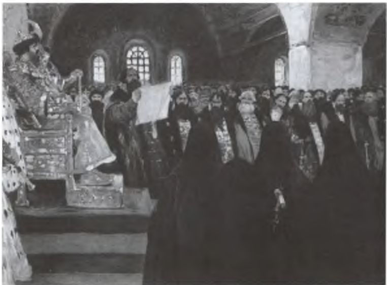
Земский собор. Художник С.В. Иванов