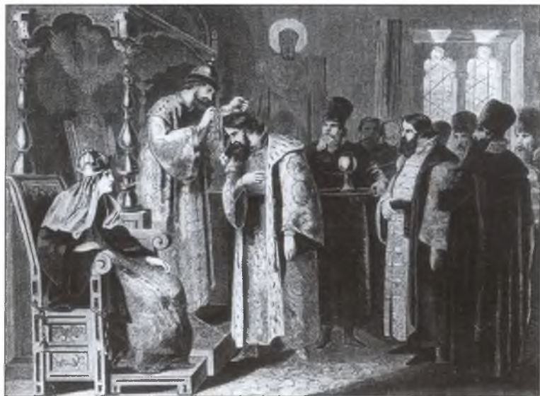
Царь Федор Иоаннович надевает на Годунова золотую цепь. Художник А. Нидерман