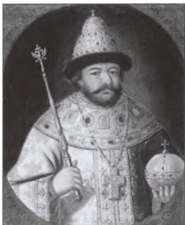
Царь Борис Годунов. Парсуна