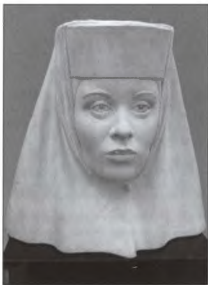
Царица Ирина (в девичестве — Годунова). Антропологическая реконструкция