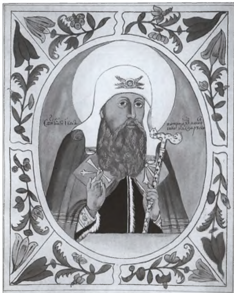
Патриарх Иов. Из «Титулярника» 1672 г.