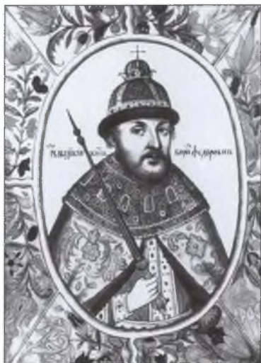
Царь Борис Годунов. Из «Титулярника» 1672 г.