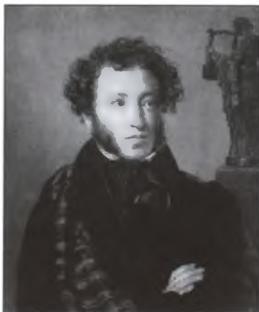
А.С. Пушкин. Художник О.А. Кипренский