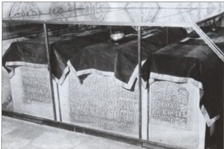
Гробница Ивана Грозного и его сыновей в Архангельском соборе Московского Кремля