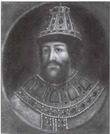
Царь Борис Годунов. Книжная иллюстрация