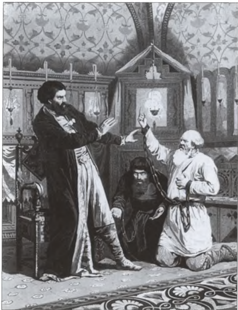
Боярин Борис Годунов и кудесники, представляющие ему царствование. Художник А.Д. Кившенко