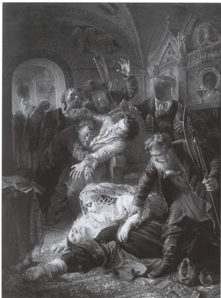
Агенты Дмитрия-самозванца убивают сына Бориса Годунова. Художник К.Е. Маковский