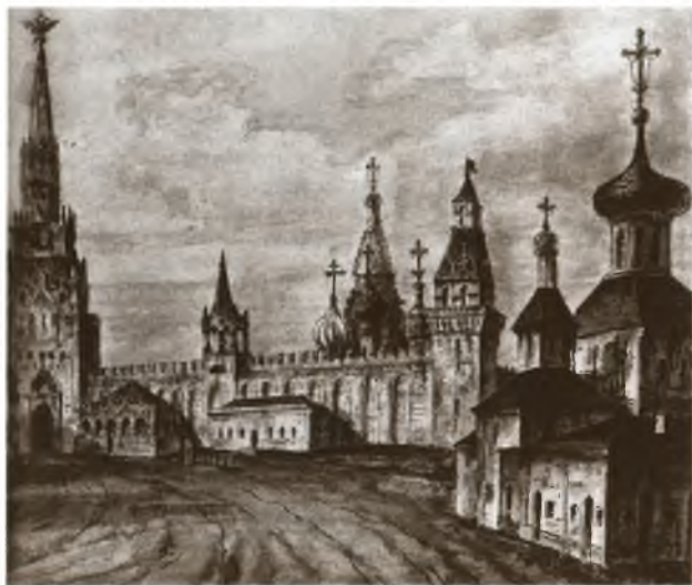
Спасская улица и церковь Николы Гостунского в Кремле. Ф. Я. Алексеев и ученики. Фрагмент. 1800-е гг.