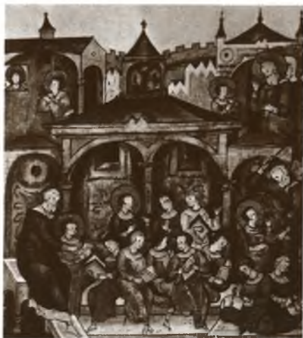
Школа. Миниатюра из «Жития Сергия Радонежского». Конец XVI в.