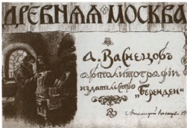
Иван Федоров в Московской типографии. А. М. Васнецов. Автолитография