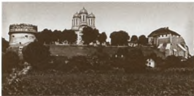
Замок в Остроге. Фото