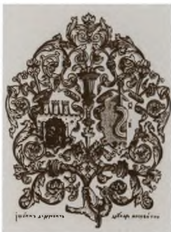
Герб Львова и типографская марка Ивана Федорова из «Апостола». 1574 г.