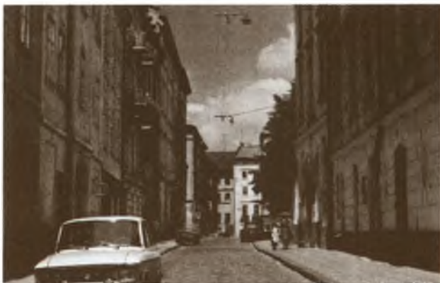
Львов. Улица Ивана Федорова. Фото 1970-х гг.