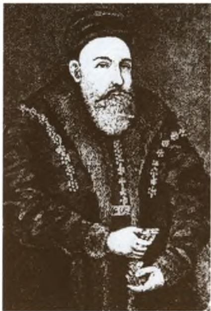
К. К. Острожский. С портрета XVII в.