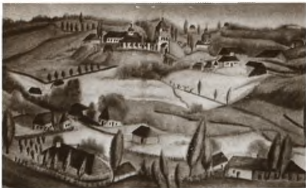
Дерманский монастырь. Рисунок А. Ежова. 1845 г.