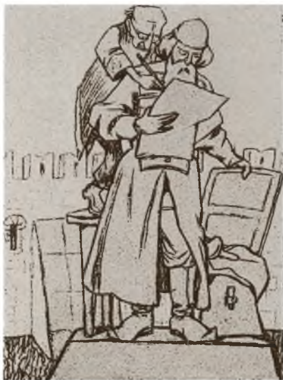
Карикатура из журнала «Будильник». 1909 г.

Старый Печатный двор на Никольской улице. Здесь в предреволюцион- ное десятилетие располагалась экспозиция, посвященная истории печатного дела. Фото начала XX в.