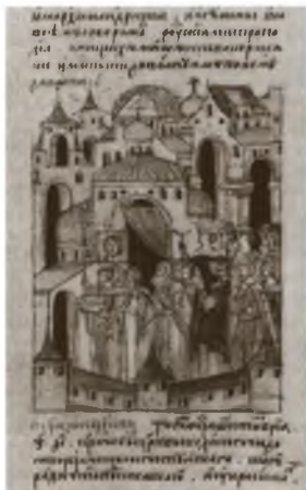
Освящение церкви Николая Чудотворца Гостунского в 1555 году. Миниатюра из Лицевого летописного свода