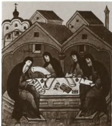
Доброписцы. Миниатюра из «Жития Сергия Радонежского». Конец XVI в.