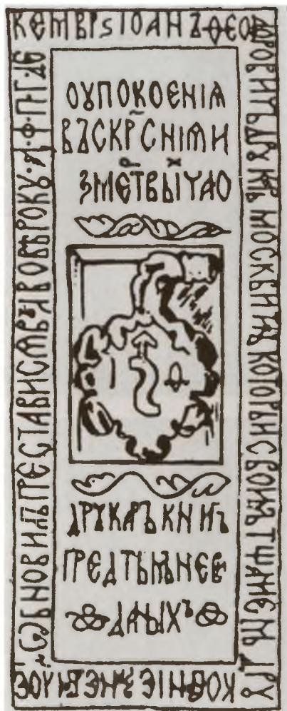
Надгробная плита Ивана Федорова. С рисунка XIX в.