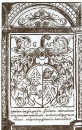
Герб Г. А. Ходкевича. Учительное Евангелие. 1569 г.