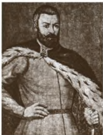
Г. А. Ходкевич. С гравюры XIX в.