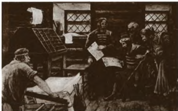
Иван Грозный в типографии Ивана Федорова. С картины Г. Лисснера