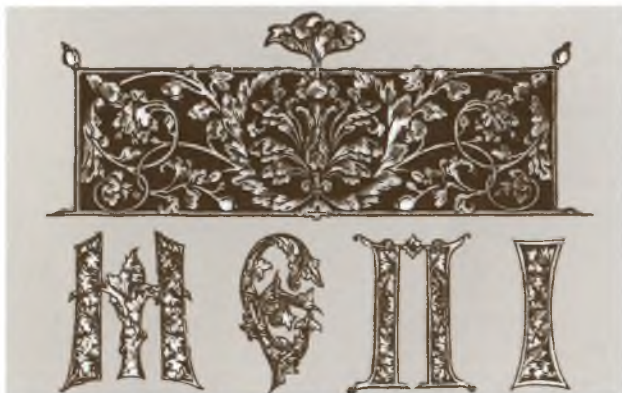
Заставка и буквицы из «Апостола». 1564 г.