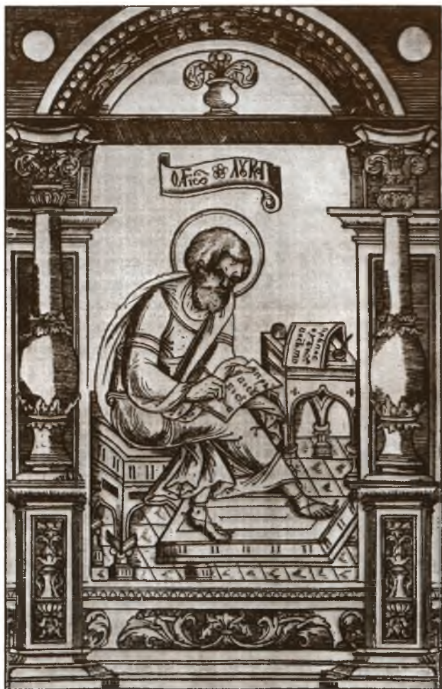
Апостол Лука. Фронтиспис львовского «Апостола»