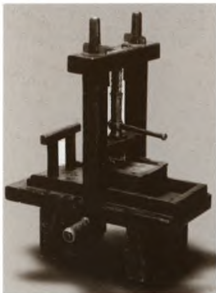
«Апостол». ► Москва. 1564 г.