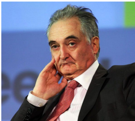
Жак Аттали.

мист, автор десятков книг, в 1992 году представил обществу свой труд «Линии горизонта» (заметим, название явно адресует к нонмадологическим «линиям ускользания»). Где описал в качестве грядущей неизбежности для земного человечества именно постмодернистский кочевнический мир.