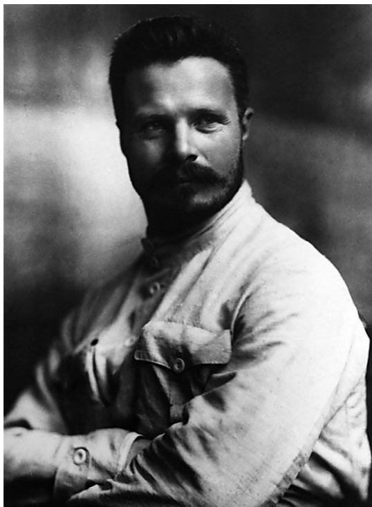
М. В. Фрунзе