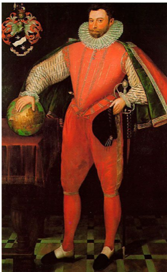
Сэр Френсис Дрейк, около 1581 г.

Национальная портретная галерея, Лондон.