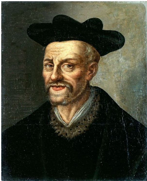
Франсуа Рабле (1494–1553)