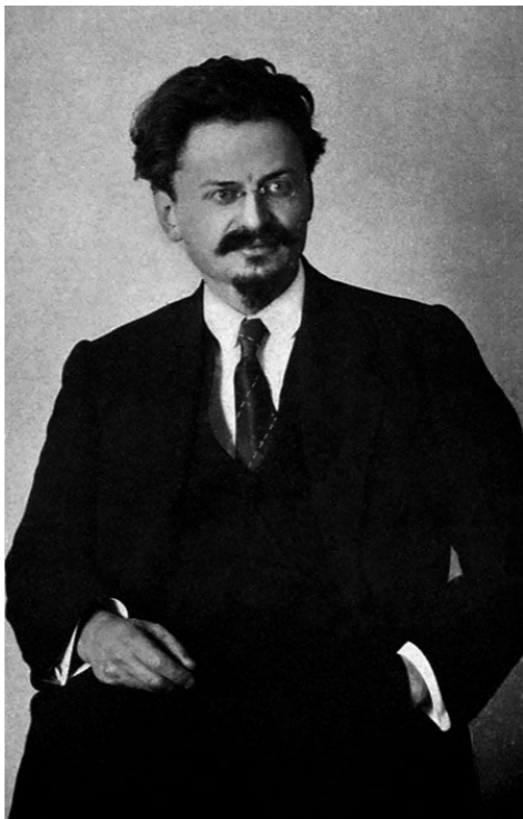
Л. Б. Троцкий