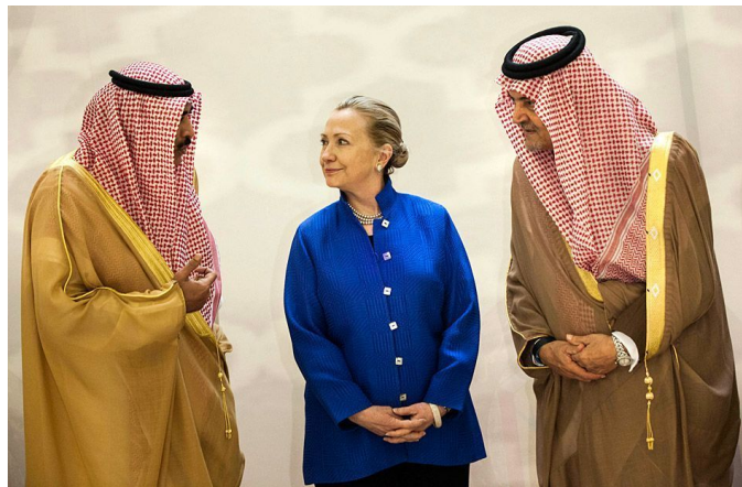
Сауд аль-Фейсал, Хилари Клинтон и Халед аль-Фейсал, март 2012 г.

В первые месяцы 2013 года управленческая элита некоторых регионов Поволжья и Юга России предприняла новые шаги по интеграции в «мировое исламское сообщество». Так как подобная интеграция довольно часто связана с возникновением нового элемента