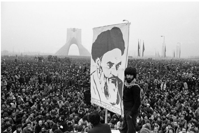
Революция в Иране, 1979 г.

В Афганистане с осени 1978 г. развернулся острый конфликт между этноплеменными фракциями правящей Народно-демократической партии Афганистана: преимущественно пуштунской «Хальк» («Народ») и преимущественно таджикской «Парчам» («Знамя»). Причём в начале 1979 г.