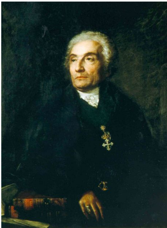
Жозеф де Местр