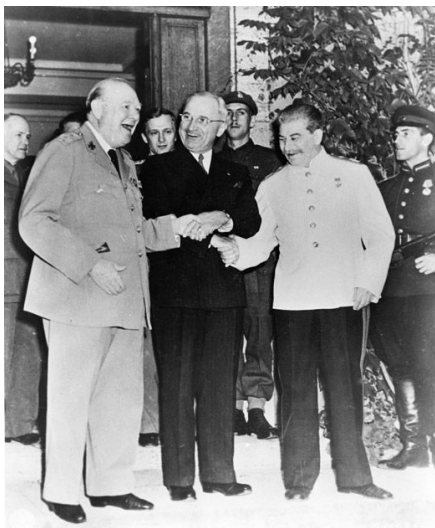
Потсдамская конференция, 1945 г. У.Черчилль, Г.Трумэн, И.Сталин

трудно компенсировать. Американцы опережали нас технологически, они были гораздо богаче, и, главное, все силы СССР были направлены на войну с фашизмом.