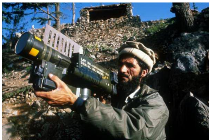
Афганистан, 1980-е годы. Моджахед со «Стингером»

ской авиационной и ракетной угрозы) наиболее мощного и современного оружия ПВО — переносных комплексов «Стингер», обладавших высокочувствительными головками самонаведения и работавшими по принципу «выстрелил и забыл».