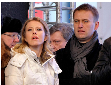
Ксения Собчак и Алексей Навальный участвуют в белоленточной акции, 2012 г.

Но предоставленные самим себе, одуроченные и захваленные ранее креаклы ещё продолжали некоторое время делать вид, что существуют. Время от времени им в этом помогали такие гиганты креативной мысли, как Юлия Латынина, Ксения Собчак, Илья Яшин... и даже Владислав Сурков. Который уже после Поклонной и после выборов Президента опубликовал статью под названием «Необходимо создать креативный класс».