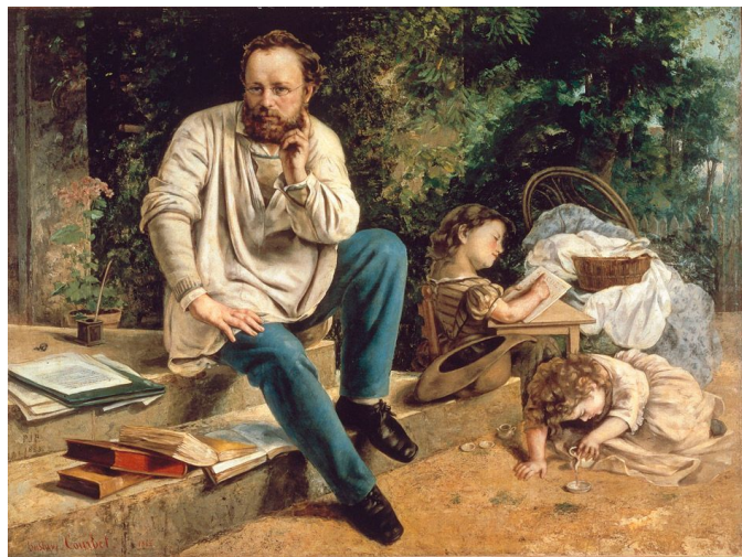
Густав Курбе. Пьер Жозеф Прудон с детьми, 1853

Одним из наиболее влиятельных теоретиков коллективистского социализма (и одновременно противников марксизма) в XIX веке был Пьер Прудон.