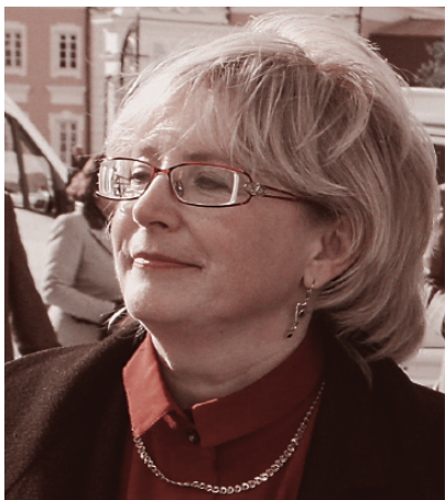
Министр здравоохранения В. И. Скворцова

вым «стандартам лечения», «при всех формах гипотиреоза показана заместительная терапия L-тироксином». Вот тут-то мы и подошли — после долгого, но необходимого вступления — к теме статьи.