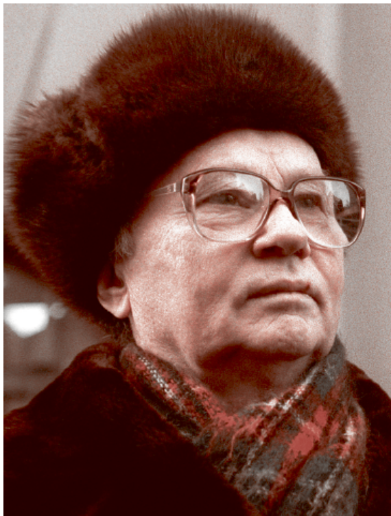
Владимир Александрович Крючков