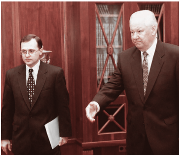
С. Кириенко и Б. Ельцин