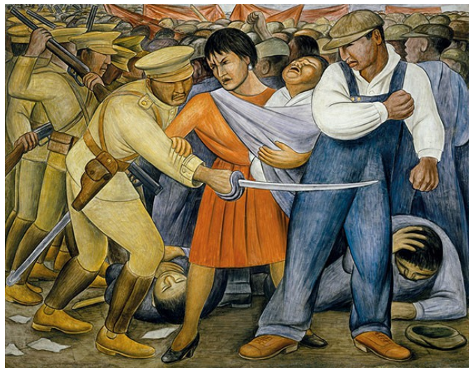
Диего Ривера. Восстание. 1931 г.

Без разговора о Духе и о враге человечества никакой глубокий диалог между разными мировоззренческими сообществами невозможен в принципе. Потому что источник беды, которую мы лицезрим в сфере, именуемой «онтология», находится за пределами