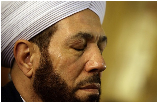
Верховный муфтий Сирии Ахмад Бадреддин Хассун

В прошлых выпусках рубрики «Миро- устроительная война» мы уже начали обсуж- дать вопрос о том, в каком направлении стала двигаться ближневосточная политика после того, как в августе текущего года не состоял- ся ожидаемый удар США по Сирии. Мы уже