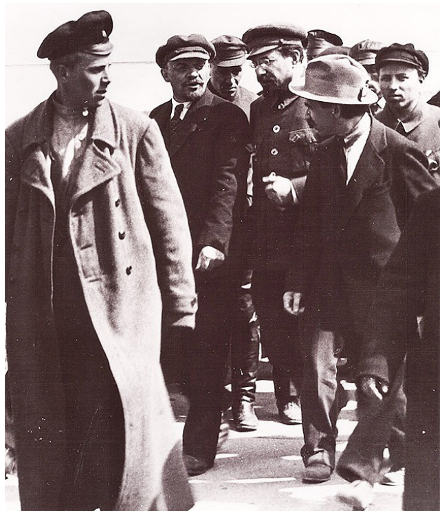
Ленин и Луначарский, 1920 г.