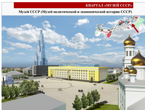
Квартал «Музей СССР»