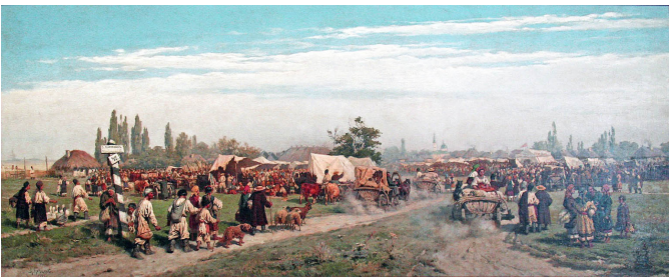
Алексей Кившенко. Ярмарка на Украине (1882)

Далеко не бесконфликтная, но всё же относительно спокойная жизнь Украины переменилась, признаем, достаточно неожиданно. Что происходит и что делать не понимает не только бóльшая часть «внешних» наблюдателей, но и подавляющее большинство населения республики и даже существенная часть её властной и экономической элиты.