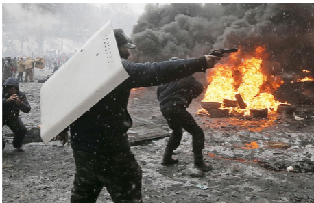
Киев, 22 января 2014 года