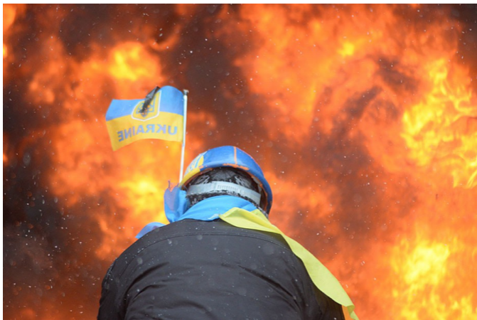
Киев, январь 2014 (Мстислав Чернов)