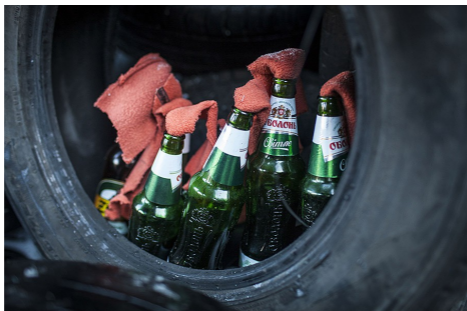
Киев, 24 января 2014 года