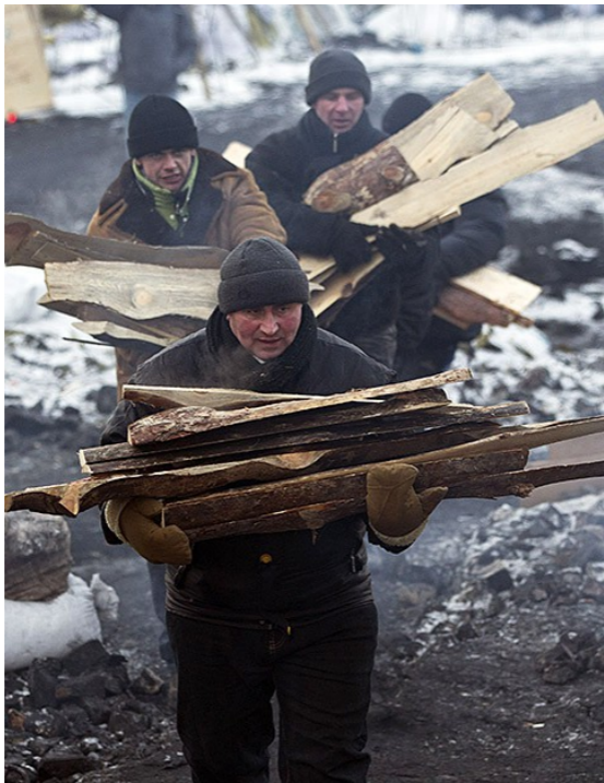
Киев, 31 января 2014 года