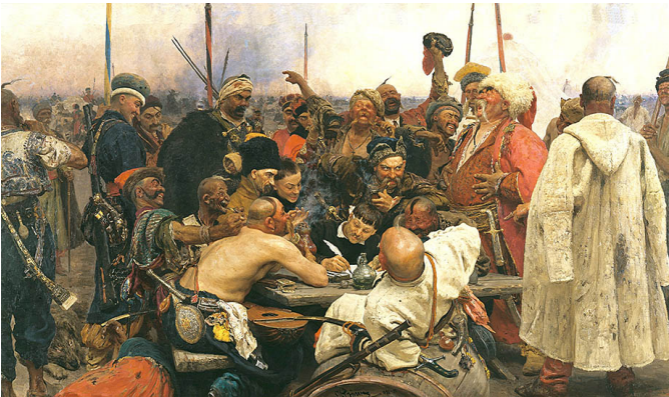
Илья Репин. Запорожцы пишут письмо турецкому султану (1880–1891)

Восточные (по левобережью Днепра) территории в основном находились в культурной и политической орбите русских князей. А в последней трети XVIII века правобережная Украина, Волынь и Подолье, а затем и Юг (Новороссия) также вошли в состав Российской империи.