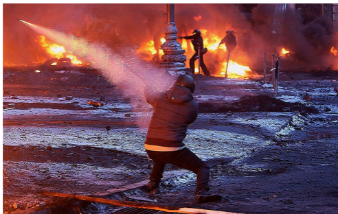
Киев, январь 2014