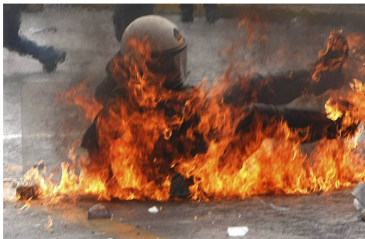
Киев, январь 2014