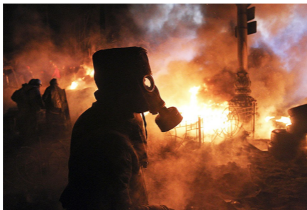
Киев, 25 января 2014 года