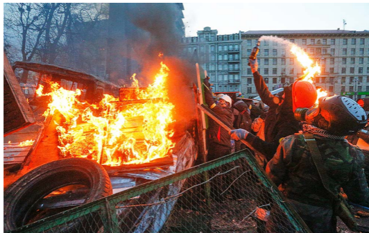
Киев, январь 2014