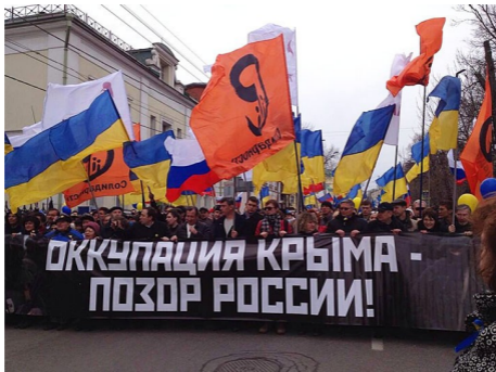
Пятая колонна на марше