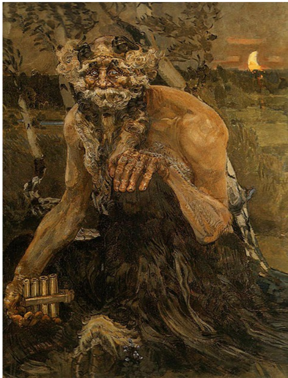
М.Врубель. Пан (1899)