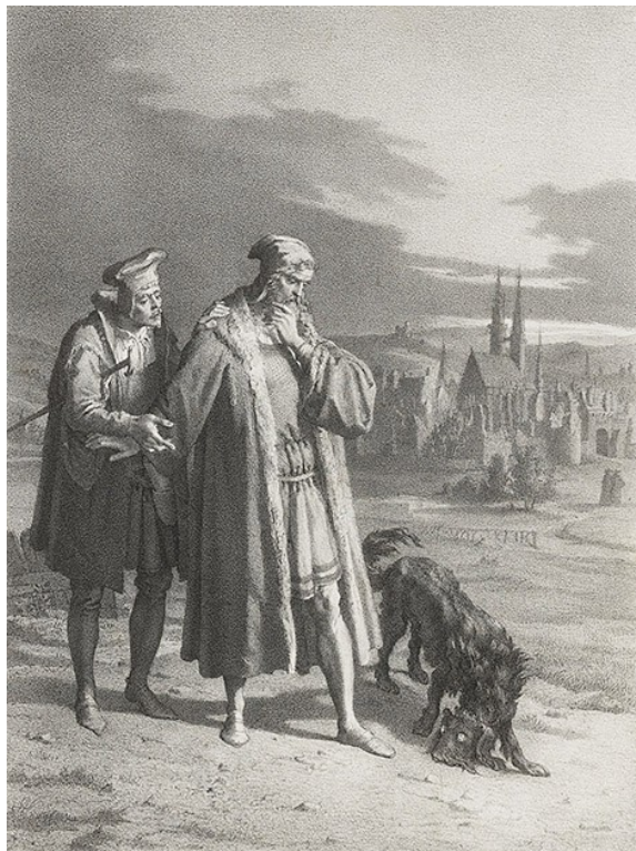
Ф.Г.Шлик. Фауст и Вагнер на прогулке