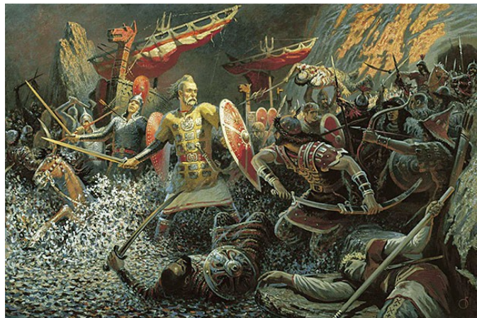
Б.М.Ольшанский. Битва дружины Святослава на Днепровских порогах

Наша нравственность, наш гуманизм, наши высокие моральные стандарты понесли за послеперестроечное время тяжёлые потери. Не хочу сказать, что фатальные, но трудно-восполнимые. В наших согражданах и в нас самих вдруг обнажились эгоизм, себялюбие,