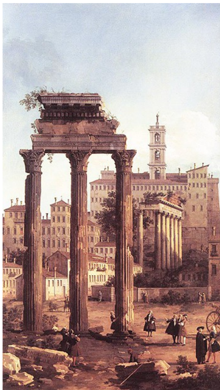
Каналетто. Руины Форума (1742)