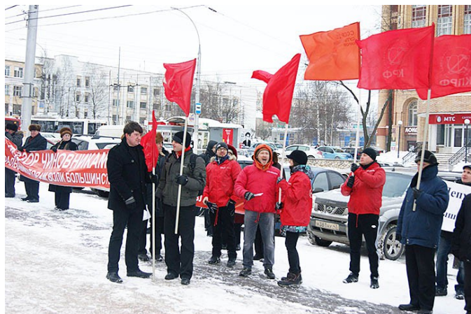
Пикет «Сути времени» в Кирове против переименования города и улиц