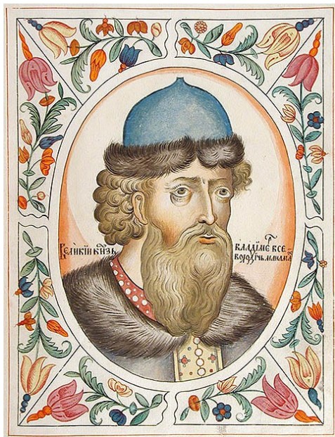
Владимир II Всеволодович (Владимир Мономах), Великий князь Киевский в 1113–1125 гг. Портрет из Царского титулярника. 1672