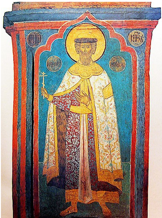
Святой Александр Невский. Фреска, 1666 г., Москва, Кремль