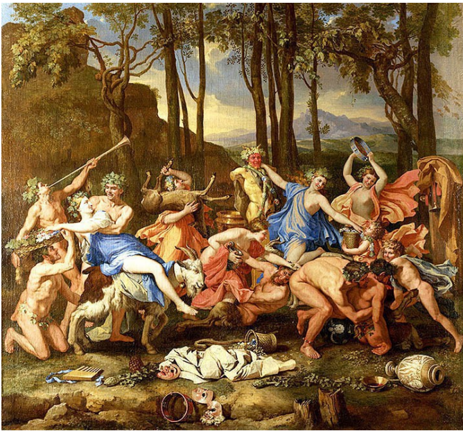
Никола Пуссен. Триумф Пана (1635)

Я уже несколько раз обращал внимание читателей на то, что пушкинский Евгений Онегин очень поверхностно знаком с интере-