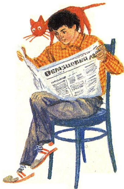
Рисунок Л. Токмакова к сказке «Джельсомино в стране лжецов»