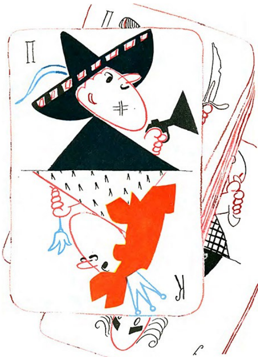
Рисунок Л. Токмакова к сказке «Джельсомино в стране лжецов»