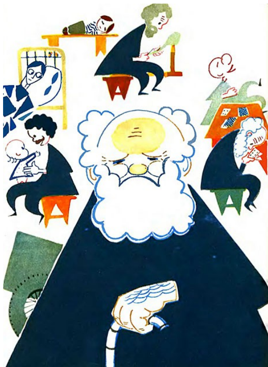
Рисунок Л. Токмакова к сказке «Джельсомино в стране лжецов»