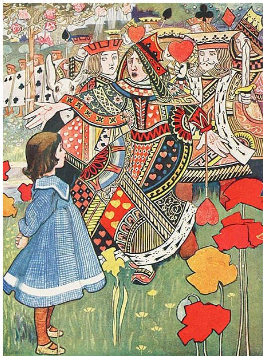
Алиса, Червонный Король и Королева. Иллюстрация Чарли Робинсона