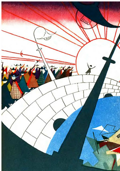
Рисунок Л. Токмакова к сказке «Джельсомино в стране лжецов»