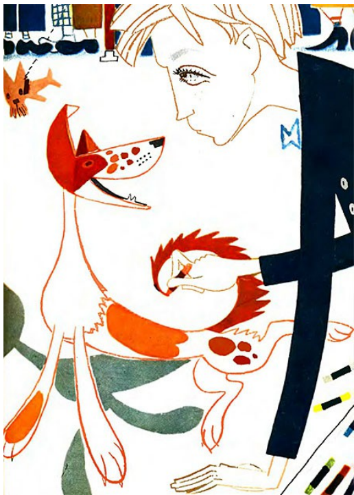
Рисунок Л. Токмакова к сказке «Джельсомино в стране лжецов»