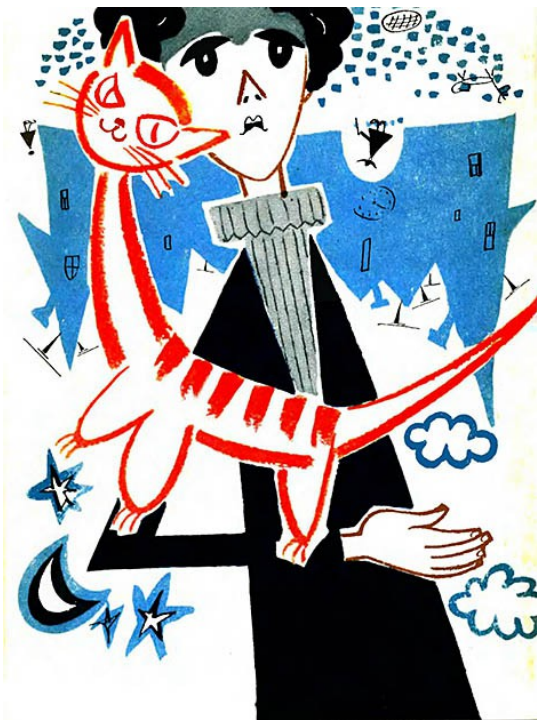
Рисунок Л. Токмакова к сказке «Джельсомино в стране лжецов»