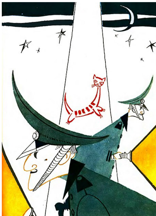
Рисунок Л. Токмакова к сказке «Джельсомино в стране лжецов»