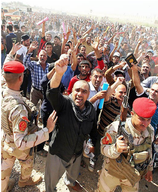
Добровольцы-шииты в Багдаде перед отправкой в тренировочные лагеря. 16 Июня 2014.