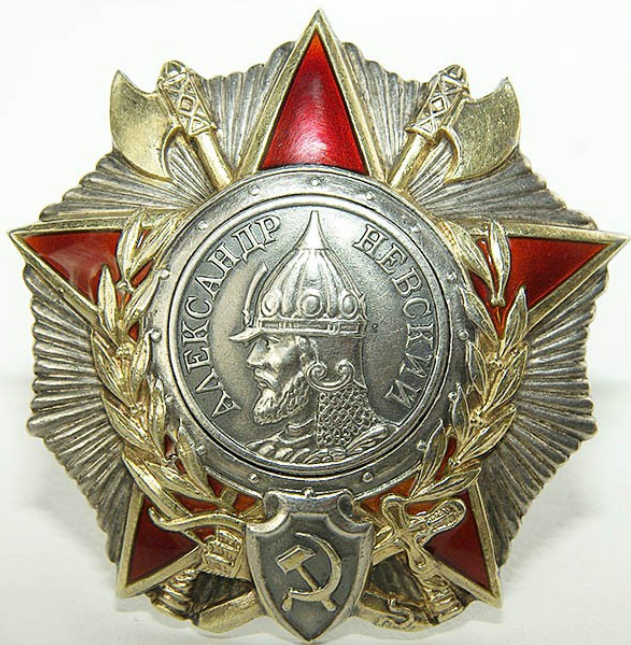
Орден Александра Невского