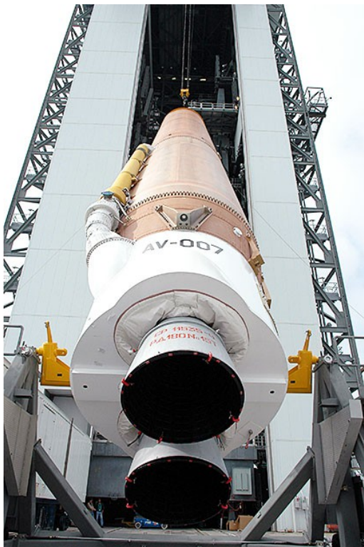
Ракета Атлас-5 с двигателем РД-180