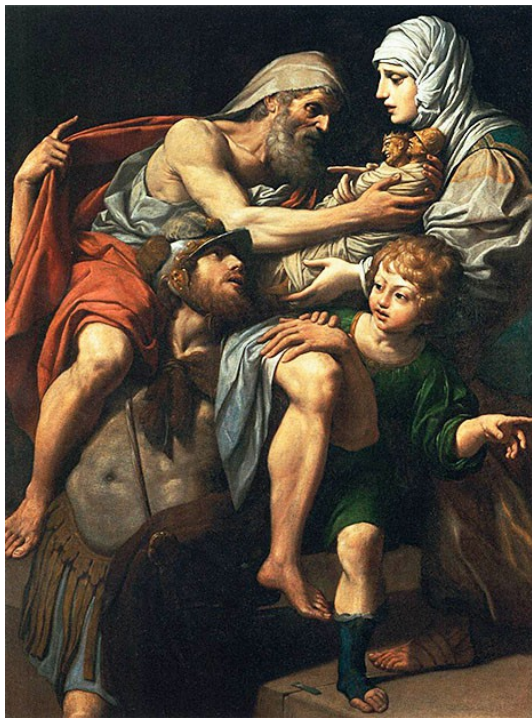
Раоло Пагани. Эней выносит Анхиза из горящей Трои