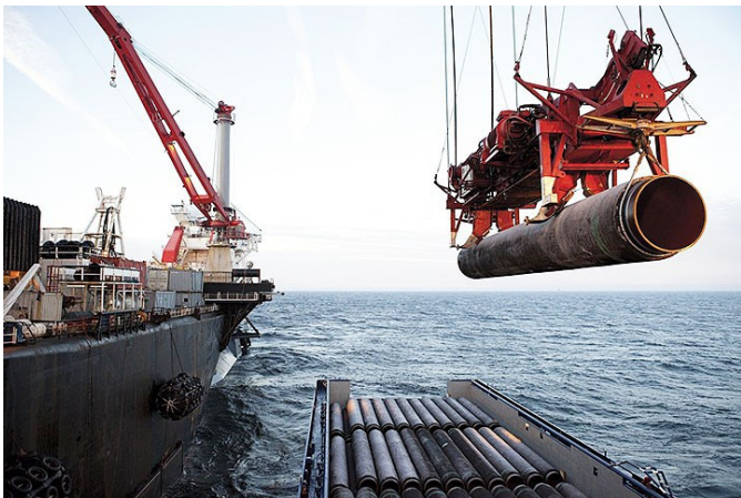
Прокладка «Северного потока»