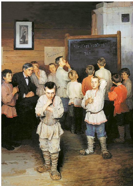
Богданов-Бельский. Устный счёт. 1895 г.