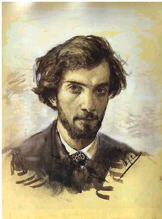
Исаак Левитан. Автопортрет. 1880 г.