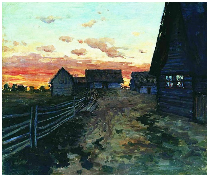
Избы. После захода солнца. 1899 г.