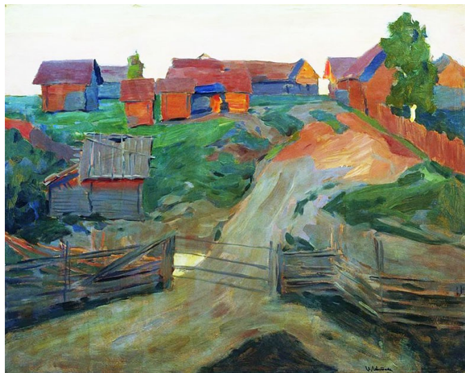
Последние лучи солнца. 1899 г.