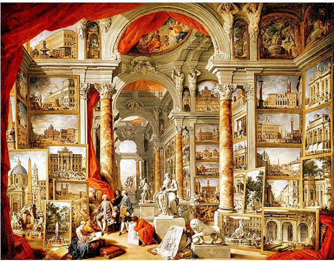
Панини. Галерея видов Древнего Рима (1757)