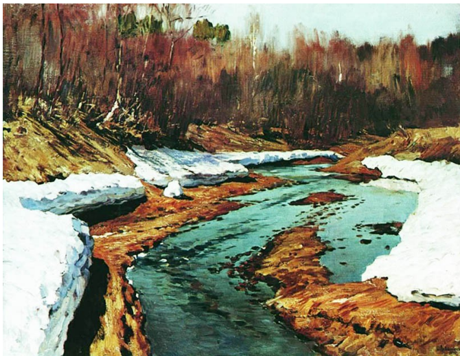
Весна. Последний снег. 1895 г.