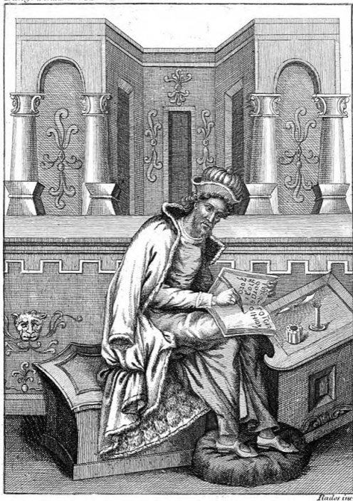
Дионисий Галикарнасский. Неизвестный художник