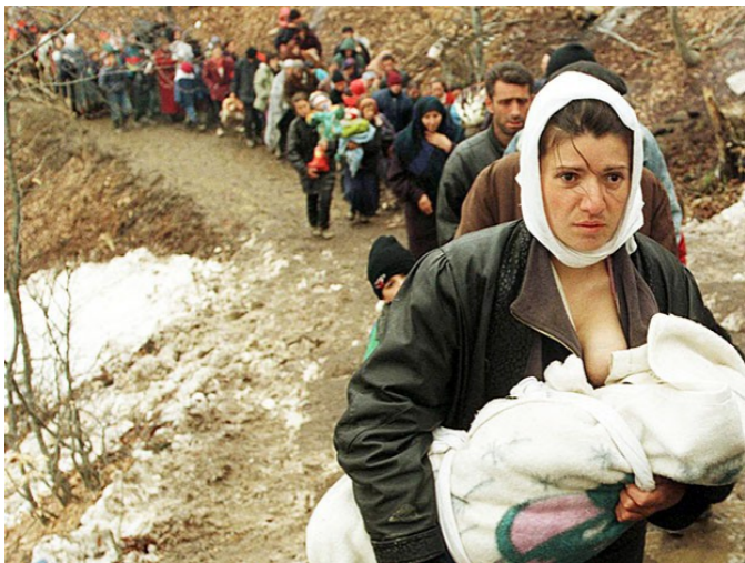
Албанская женщина с ребёнком в колонне беженцев. 1999 г.

Как мы уже обсудили, новизна нынешней эпохи состоит в том, что США получили двуединый мощный концептуальный инструмент влияния на массы и элиты стран, кото-