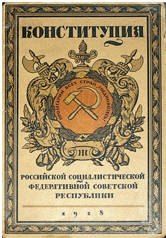
Обложка Конституции РСФСР 1918 года