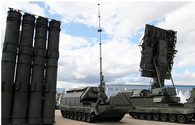
Командный пункт 9С457 — в составе зенитной ракетной системы С-300В

Беседы с профессионалами, обеспокоенными теми или иными вопросами национальной безопасности и обороноспособности РФ, — это отдельный и очень непростой род деятельности. Осуществление которого должно быть основано на трёх принципах.