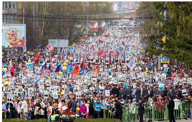
Бессмертный полк — Томск