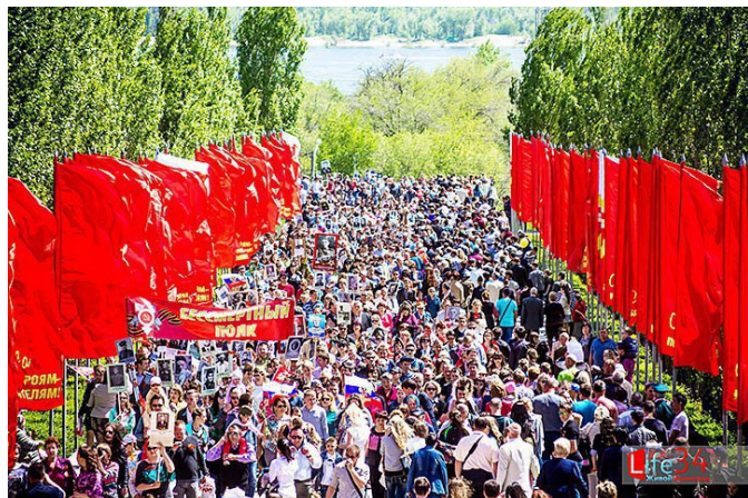
Бессмертный полк — Сталинград