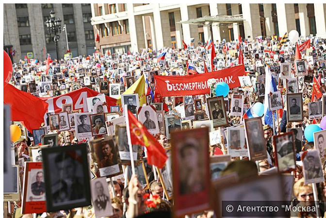
Бессмертный полк — Москва