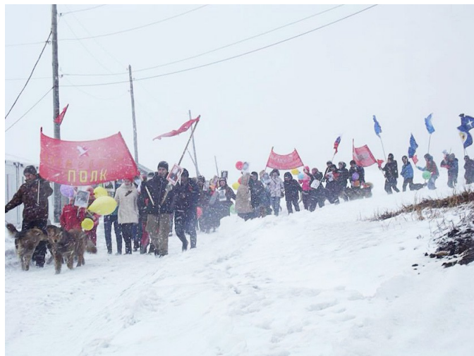
Бессмертный полк — Якутия