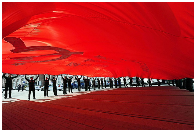
«Бессмертный полк» — Москва, 9 мая 2015 года