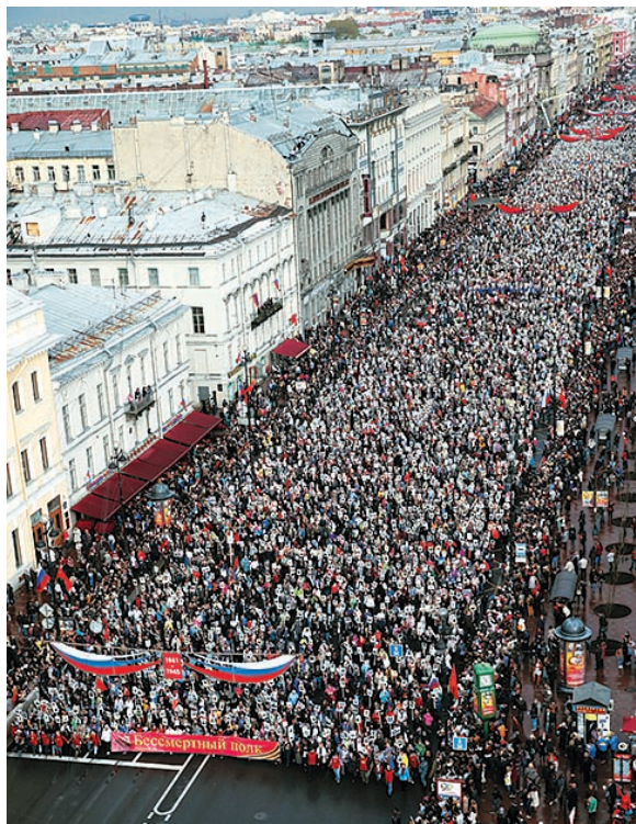
Бессмертный полк — Ленинград