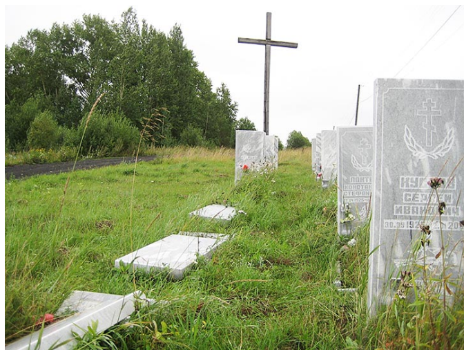
«Аллея славы». Пос. Лесной