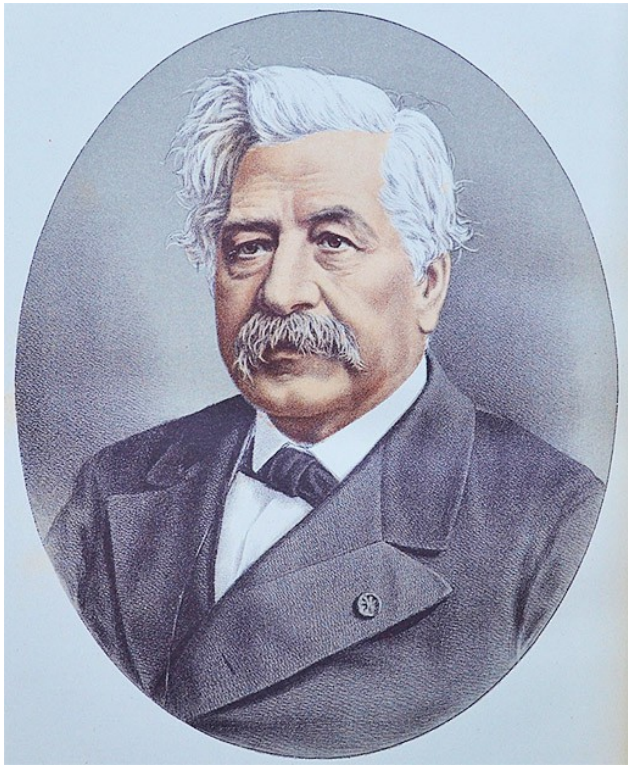
Фердинанд де Лессепс