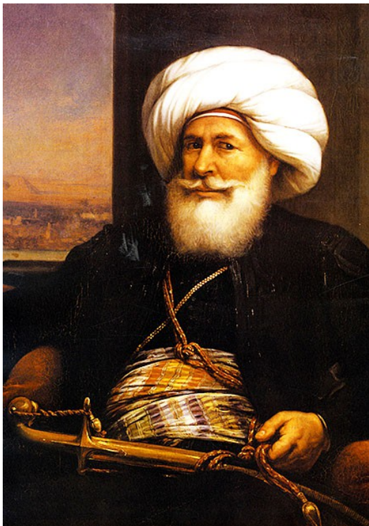
Огюст Кудер. Мухаммед Али-паша (1841)