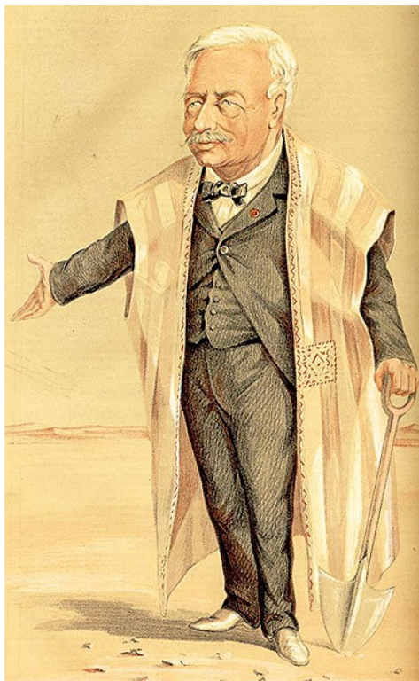
Карикатура на Фердинанда Лессепса