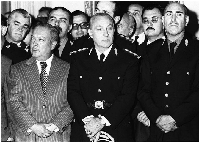
Лопес Рега — лидер аргентинских «эскадронов смерти»