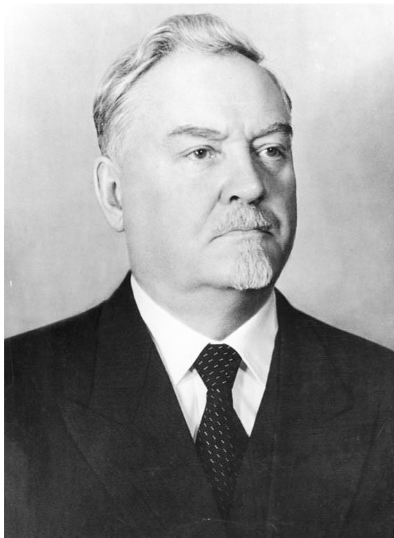
Николай Александрович Булганин