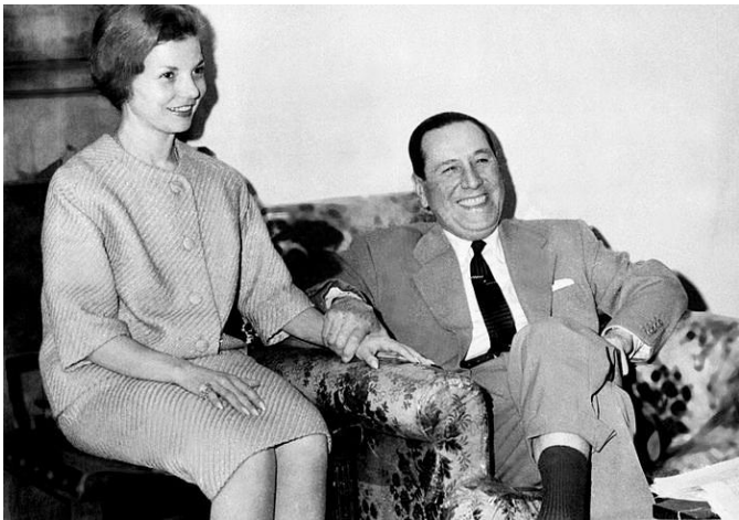
Исабель и Хуан Перон