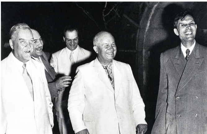
Николай Булганин, Лазарь Каганович, Михаил Первухин, Никита Хрущёв, Михаил Суслов

В одно время с проведением амнистии, которая смягчала наказание осуждённым, но не ставила под сомнение законность приговора, Берия начал проводить реабилитацию незаконно осуждённых, а также останавливать громкие политические процессы, которые начались при Сталине. В частности, в МВД были созданы специ-