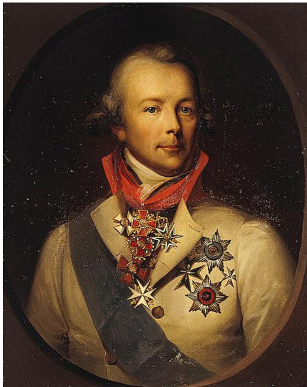
Пётр Алексеевич Пален