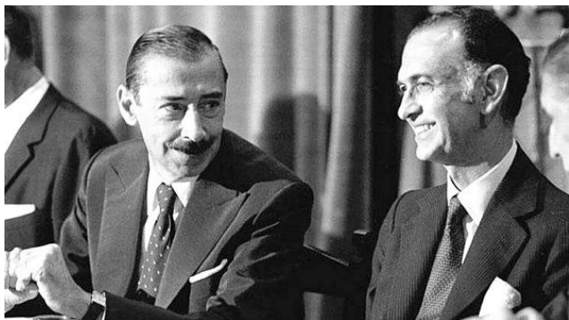
Хорхе Видела и Хосе Мартинес де Ос