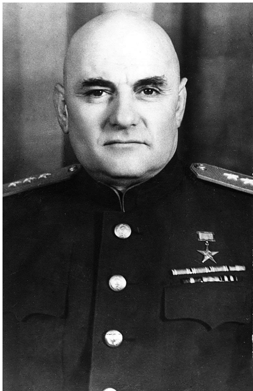
Борис Львович Ванников