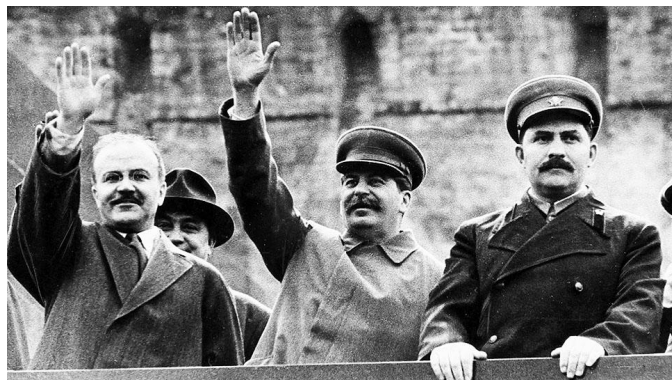
Молотов, Сталин, Каганович