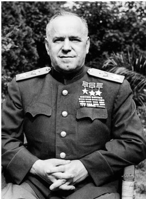
Георгий Константинович Жуков