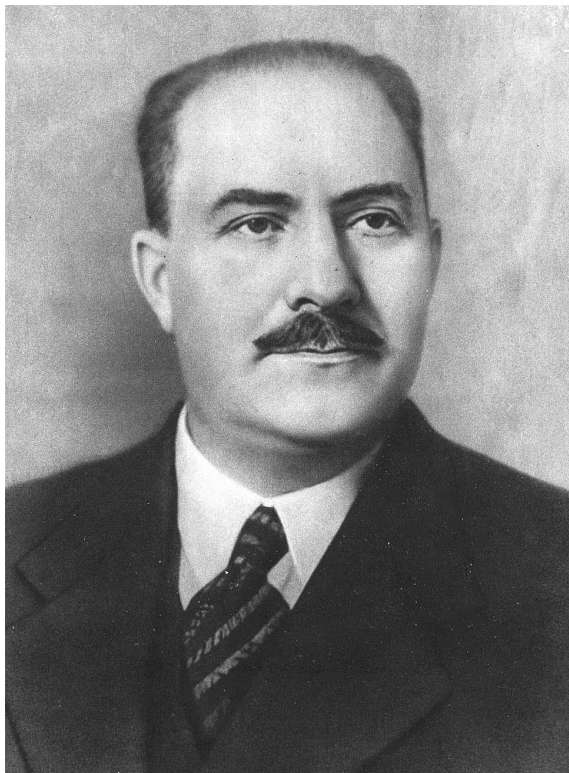
Лазарь Моисеевич Каганович