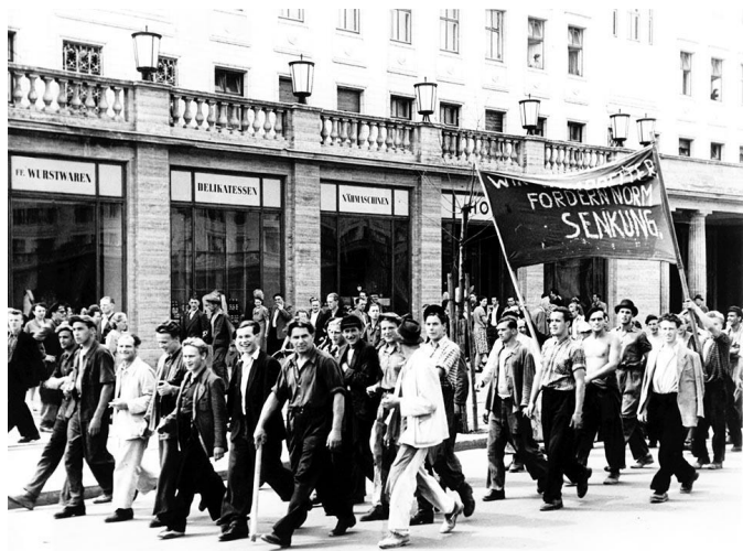
Берлин, июнь 1953 года