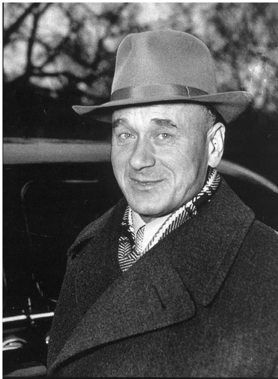
Иван Александрович Серов, 1956