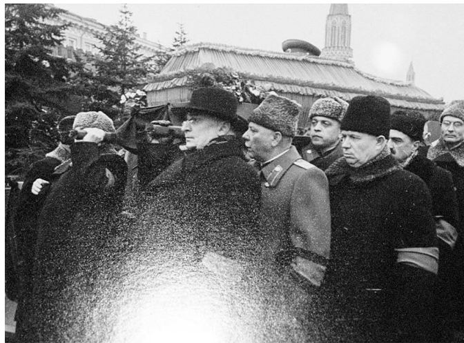
Берия, Ворошилов и Хрущёв на похоронах Сталина