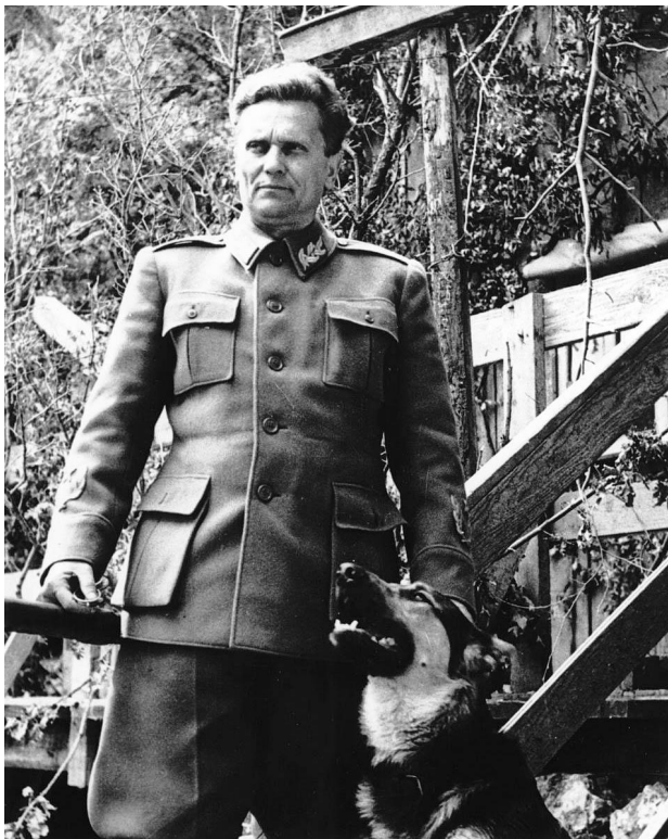
Иосип Броз Тито в июне 1944 года