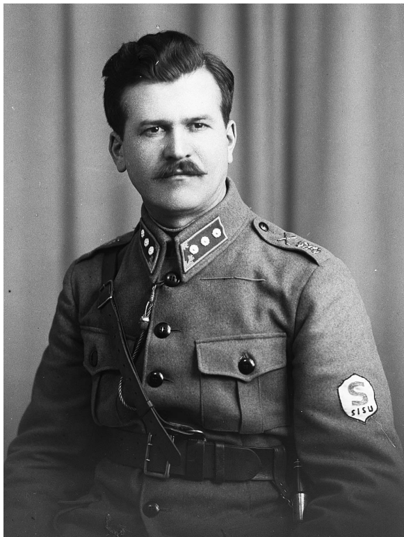
Имре Надь, 1942 год