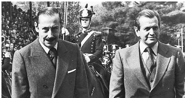
Хорхе Видела и Хорхе Соррегьета