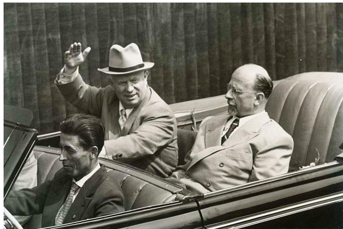
Никита Хрущёв и Вальтер Ульбрихт