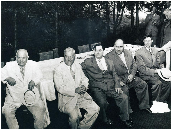
Никита Хрущёв, Николай Булганин, Георгий Маленков, Лазарь Каганович, Михаил Суслов на подмосковной даче