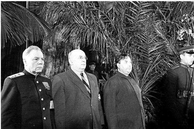
Похороны Сталина - в почётном карауле Ворошилов, Берия и Маленков, 1953 год