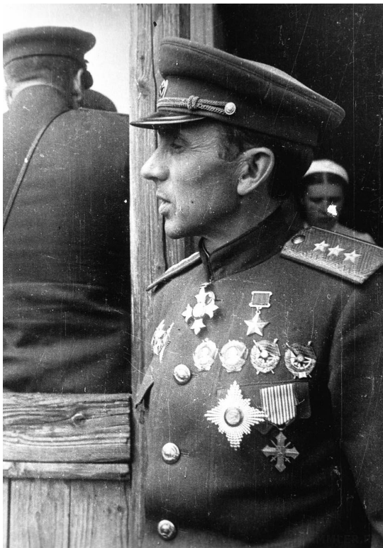
Кирилл Семёнович Москаленко