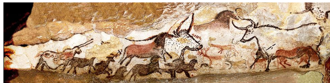
Наскальная живопись эпохи мезолита. Пещера Ласко, Франция

Борьба человечности и предшествовавшего её возникновению всецельного звериного начала носит неотменяемый характер