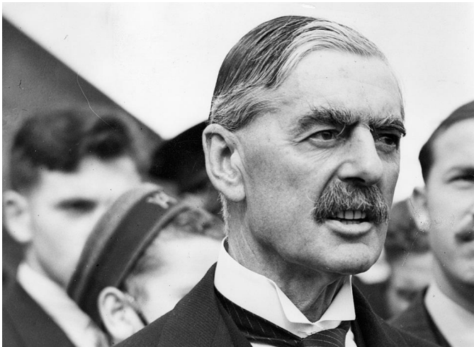
Британский премьер-министр Невилл Чемберлен, после встречи с Гитлером. 24 сентября 1938 г.