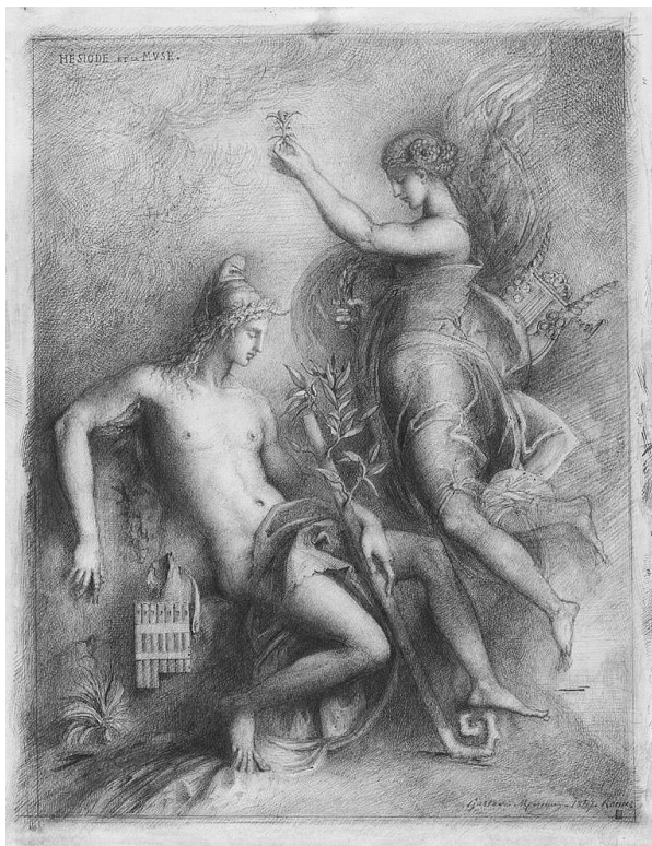
Гюстав Моро. Гесиод и Муза. 1857 г.