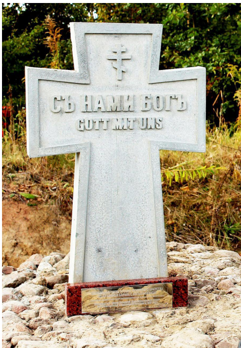
Памятник в «честь русско-немецкого братства по оружию в борьбе с большевиками» в посёлке Ярославское, Калининградская область