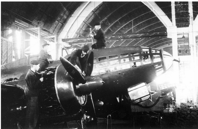
Сборка бомбардировщик Ил-4 на Иркутском авиационном заводе в годы Великой Отечественной войны