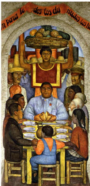
Диего Ривера. Наш хлеб. 1928 г.