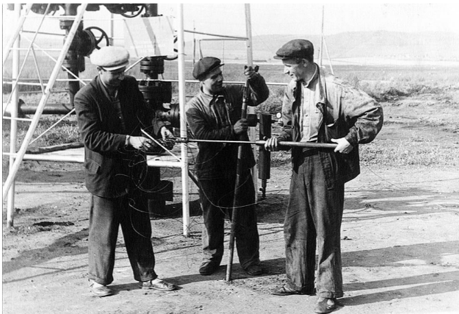
Исследование фонтанной скважины, ТАССР. 1950-е

Сейчас общеизвестно, что экономика России критически зависит от нефтегазового экспорта. Но в этом дуэте нефти и газа определяющую роль играет именно нефть.