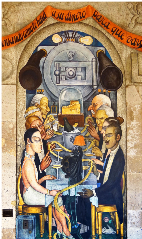
Диего Ривера. Банкет на Уолл-стрит. 1928 г.