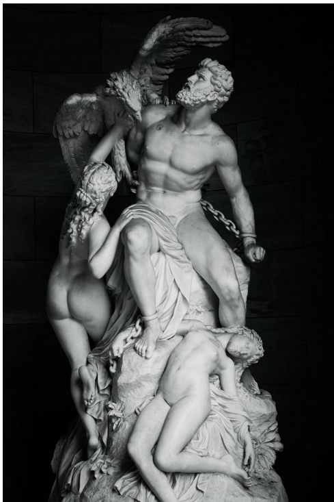
Статуя Прометея в Старой национальной галерее Берлина