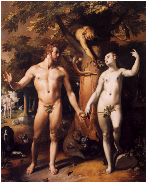
Корнелис Корнелиссен. Грехопадение. 1592 г.