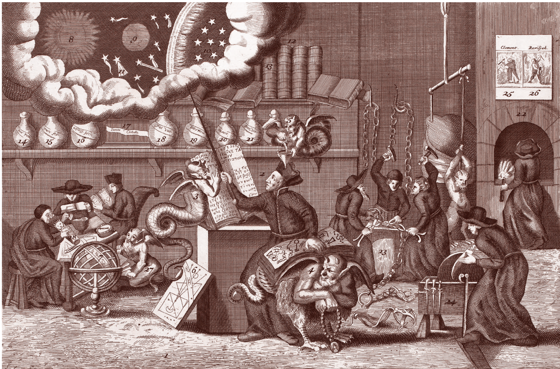
Пол ван Сомер II (притискивается). Карикатура о дьявольском искусстве отца Петерса (Эдварда Петре), который вместе с католиками и бесами занят работой в алхимической лаборатории. 1689

воточат и превращаются в кровавые, бесформенные массы. Некоторые из этих лихорадок убивают до 90 процентов тех, кто ими заразился, и они могут передаваться при тесном контакте с биологическими жидкостями, возможно, даже при чихании.