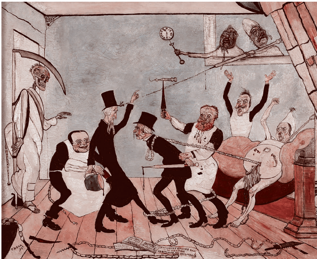
Джеймс Энсор. Плохие врачи. 1892

Тем не менее врач-ученый, который проводил экскурсию, был начисто лишен подобного рода апломба, по крайней мере, внешне. Экскурсовод встретил нас очень доброжелательно, провел в свой кабинет, выдал чистую красивую форму из стопроцентного хлопка и стал показывать новый медицинский центр. По всему было видно, что и само учреждение ему очень нравится, и работать в этом центре также очень нравится. Он как бы говорил нам: «Моя мечта осуществилась, я наконец-то стал заниматься самой настоящей, а не абы какой медициной! Это счастье!»