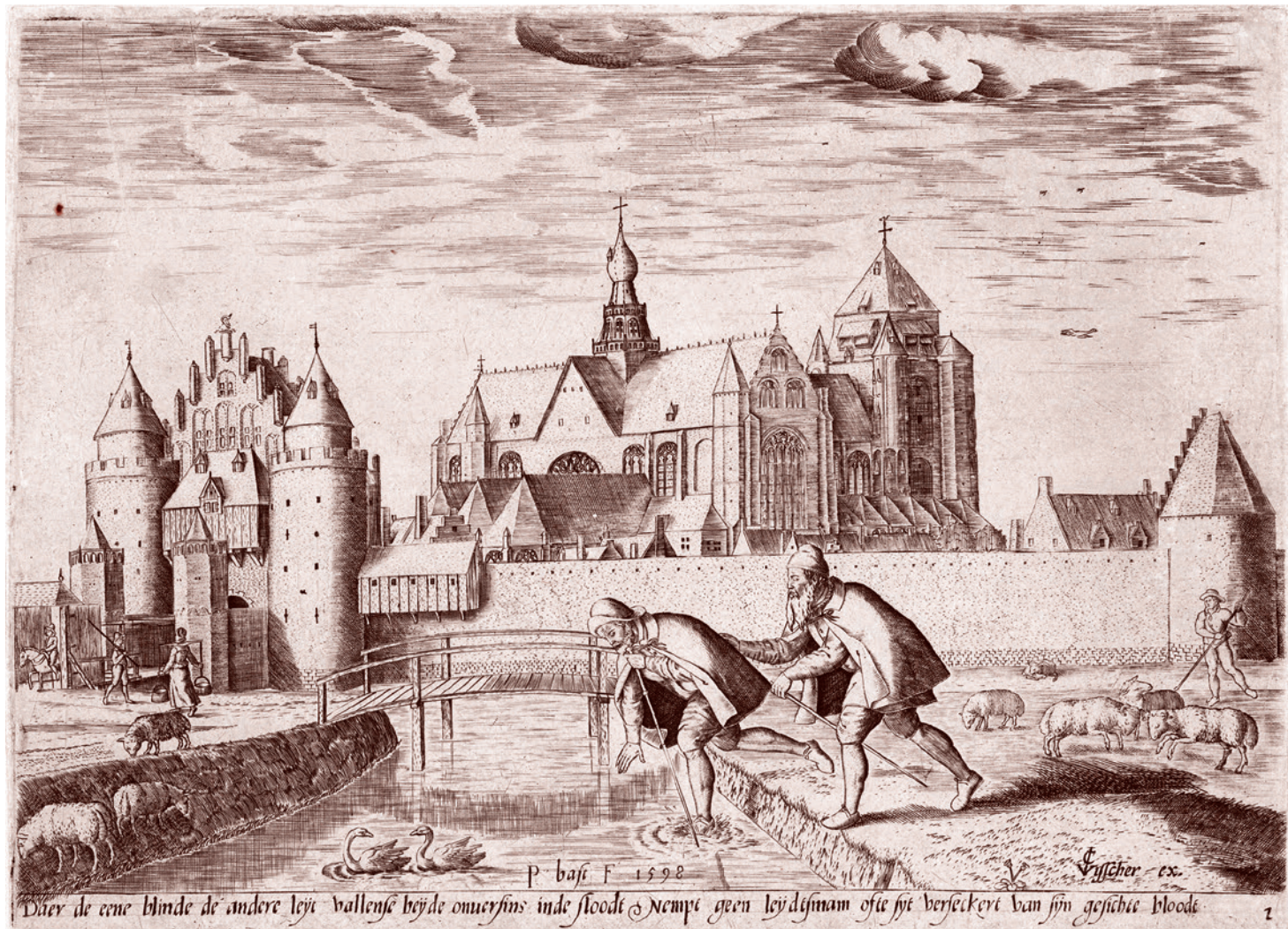
Питер Баст. Слепой ведет слепого. 1598

По первому пункту наблюдается полное несоответствие. Никакой четкой карти-