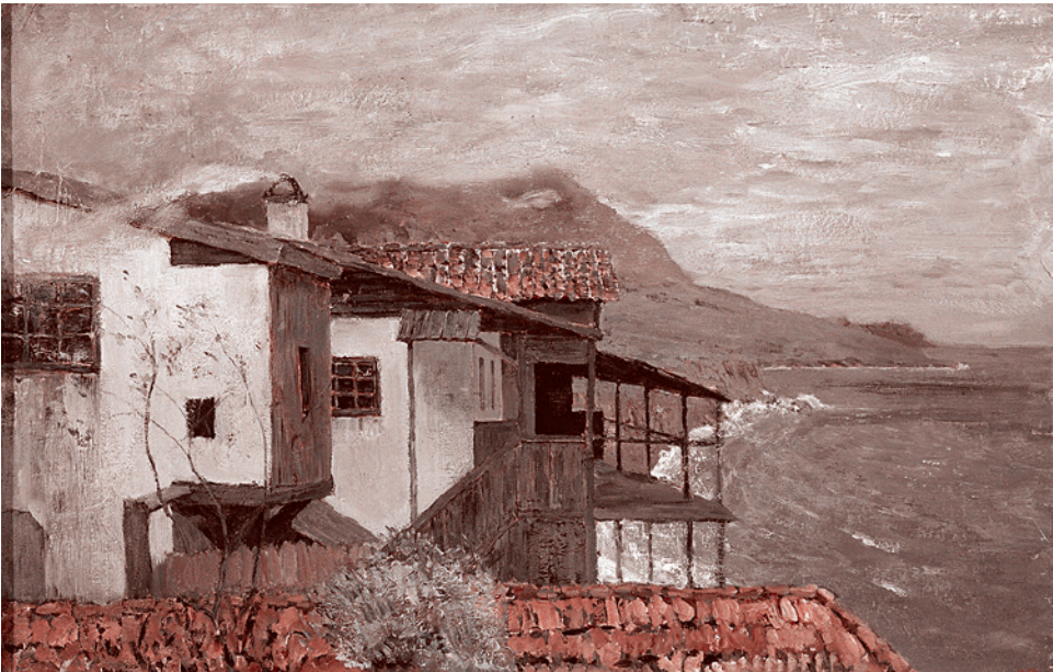
Исаак Ильич Левитан. У берега моря. Крым. 1886

Депутатов от партии Порошенко беспокоит решение о переносе сроков проведения в Киеве заседания Парламентской ассамблеи (ПА) НАТО из-за пандемии, а также то, что «президент подписывает Годовую национальную программу сотрудничества под эгидой комиссии Украина — НАТО на 2020 год [лишь] в конце мая».