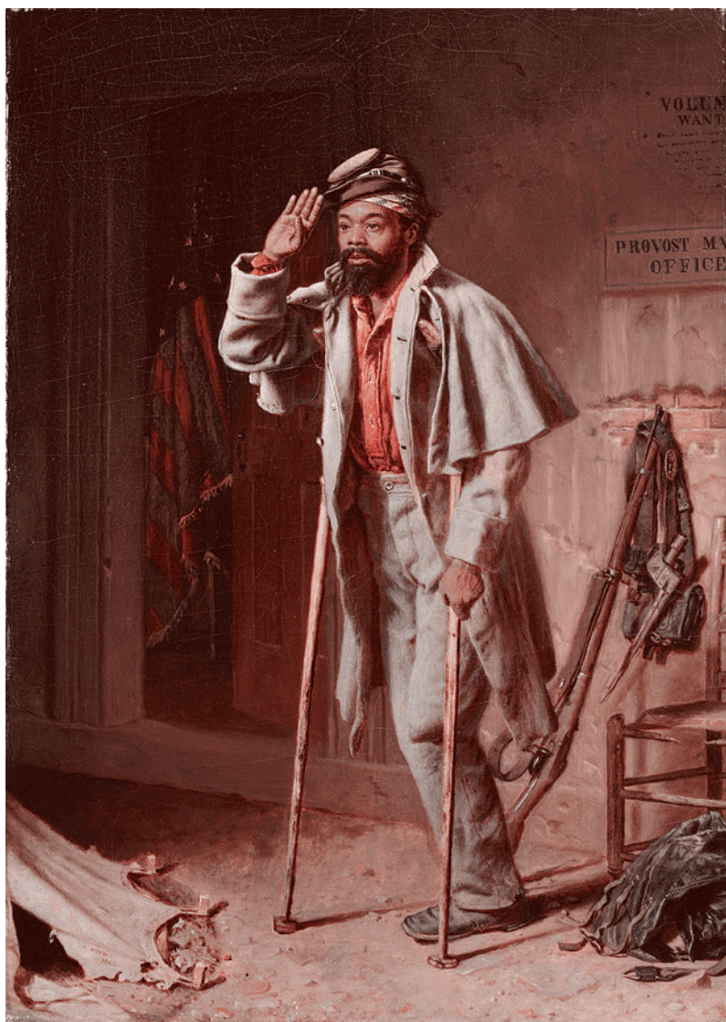
Томас Утеман Вуд. Немного истории войны — Ветеран. 1866

У этих двух элит были несовместимые экономические интересы. Промышленникам на Севере нужен был протекционизм, чтобы монополизировать свои внутренние рынки сбыта. Возможность получить доступ к дешевой рабочей силе в виде открепленных от плантаций бывших рабов тоже казалась привлекательной. Плантаторам же нужен был как можно более либеральный режим торговли с Европой, чтобы выгодно покупать импортные промышленные изделия за выручку от экспорта своего хлопка и табака. Именно поэтому формально нейтральные Великобритания и Франция оказывали материальную помощь Югу в течение войны.