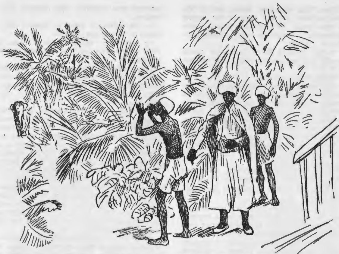
Диса крикнул на таинственном, слоновьем языке.

одну тонну, оторвавшейся во время сильной морской качки. Он хлопал старых приятелей по спине и спрашивал их, легко ли выдерживаются пни, нес чепуху о работе и неотъемлемом праве слонов на долгий полуденный отдых; бродя взад и вперед, он успел перемотать все стадо еще до заката, когда вернулся в свой загон на кормежку.