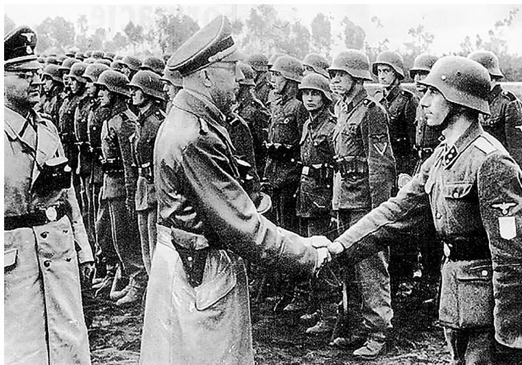
Гитлеровское руководство очень «заботилось» об Украине и особо — о дивизии СС «Галичина».

были уничтожены, не запугивать, а физически уничтожать! Не надо бояться, что люди проклянут нас за жестокость. Пусть из сорока миллионов украинского населения останется половина — ничего страшного в этом нет». Как говорят в таких случаях, комментарии излишни.