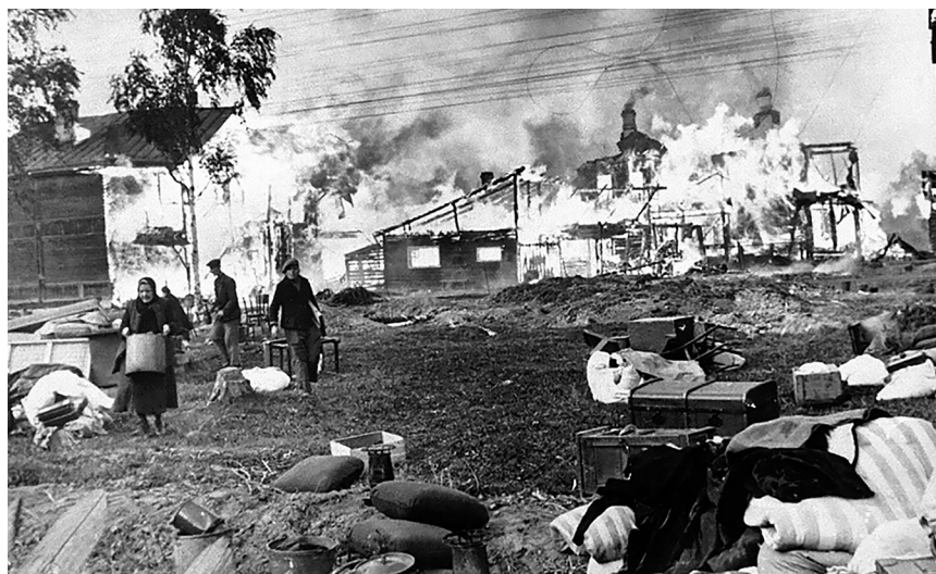
В фашистском огне — дома и жители Ленинградской области. Год 1941-й.

Да, поднятый в преддверии 70-летия Великой Победы на страницах нашей газеты вопрос о достойном увековечении памяти