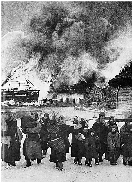
Пылает подмосковная Истра, которую фашисты захватили в конце октября 1941 года. Множество ее жителей погибли или остались без крова в лютый мороз.

стов лишний раз подчеркивают фарисейство тех, кто пытается приводить «факты милосердия» немецких солдат на оккупированных территориях.