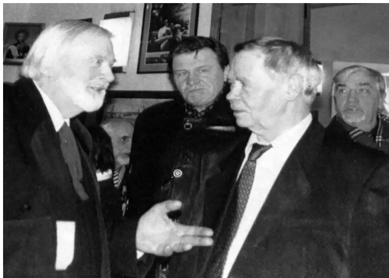
Автор этого письма, выдающийся отечественный экономист и эколог, с выдающимся русским писателем В.Г. Распутиным.

«Сегодня мы живем в оккупированной стране, в этом не может быть никакого сомнения. То, чего врагам нашего Отечества не удавалось добиться на полях сражений, предательски содеялось под видом демократических реформ, которые вот уже пятнадцать лет беспрерывно продолжают бомбить Россию. Разрушения и жертвы — как на войне, запущенные поля и оставленные в спешке территории — как при отступлении, нищета и беспризорничество, бандитизм и произвол — как при чужеземцах. Что такое оккупация? Это устройство чужого порядка на занятой противником территории. Отвечает ли нынешнее положение России этому условию? Еще как! Чужие способы управления и хозяйствования, вывоз национальных богатств, коренное население на положении людей третьего сорта, чужая культура и чужое образование, чужие песни и нравы, чужие законы и праздники, чужие голоса в средствах информации, чужая любовь и чужая архитектура городов и поселков — все почти чужое, и если что позволяет свое, то в скудных нормах оккупационного режима».