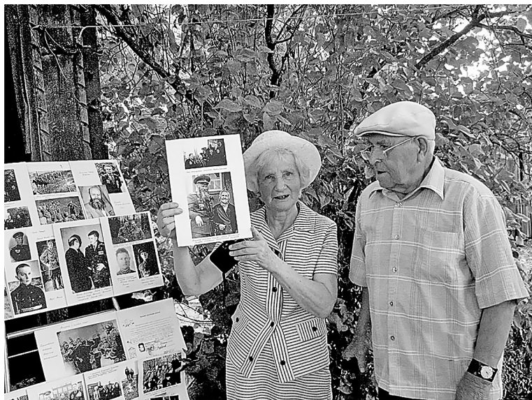
Вот и опять выступает она перед своими земляками с интересным рассказом о людях, завоевавших Великую Победу.

уникальный школьный историко-краеведческий музей. Впрочем, работа ее настолько огромна и многообразна, что в рамках одной газетной статьи передать все весьма не просто.