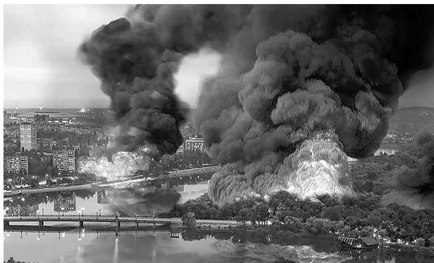
Под массированным обстрелом — мирное население Донецка. Год 2014-й.

Именно поэтому среди предложений, которые высказываются в письмах, есть идея создать музей фашистской оккупации, который