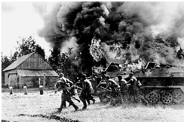
Немецкие солдаты рядом с танками движутся по горящей русской деревне 26 июня 1941 года.