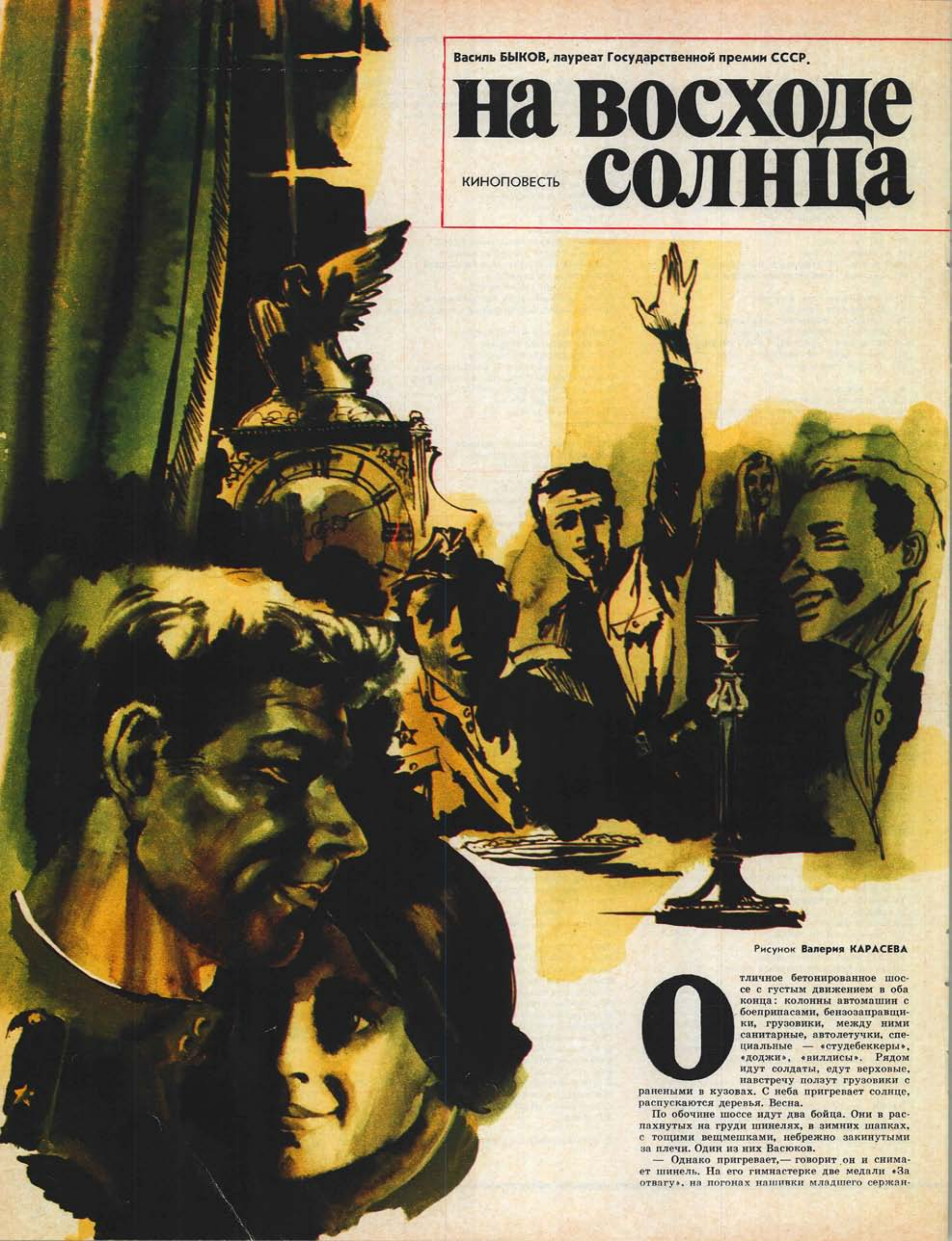
Рисунок Валерия КАРАСЕВА

О тличное бетонированное шоссе с густым движением в оба конца: колонны автомашин с боеприпасами, бензозаправщики, грузовики, между ними санитарные, автолетучки, специальные — «студебеккеры», «доджи», «виллисы». Рядом идут солдаты, едут верховые, навстречу ползут грузовики с ранеными в кузовах. С неба пригревает солнце, распускаются деревья. Весна.