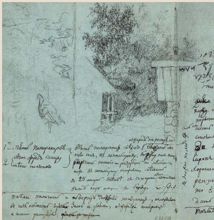
Набросок вида хозяйственных построек мызы. Рисунок О.А. Кипренского. 1807 г. Бумага, итальянский карандаш

Источник: Государственный Русский музей (Санкт-Петербург). Шифр: Р-30413