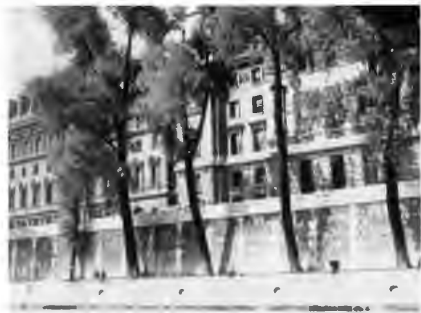
Набережная Орфевр на острове Ситэ