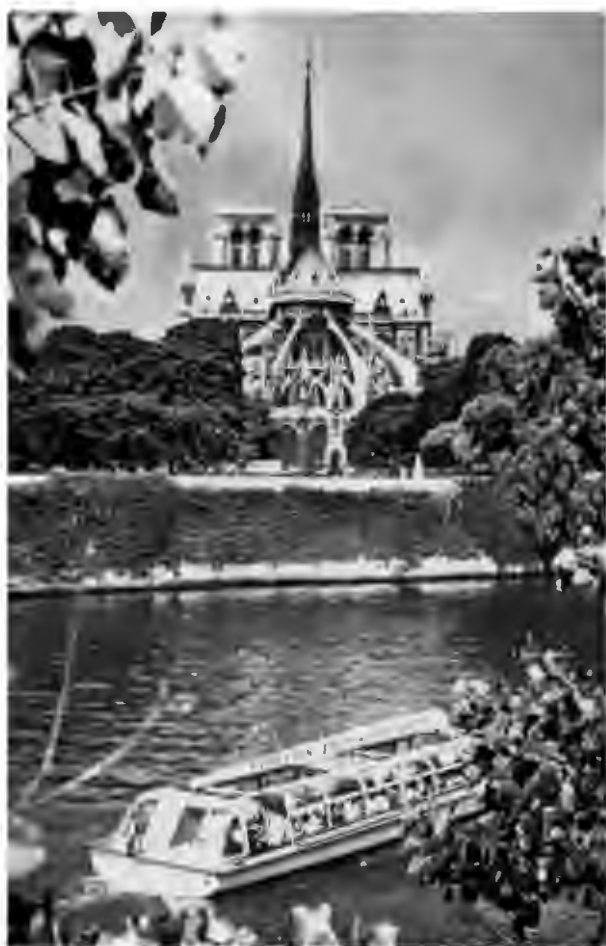
Вид на остров Ситэ и Нотр-Дам