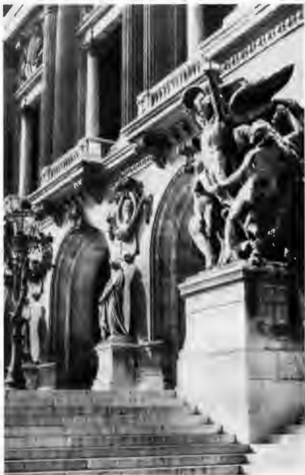
Фрагмент фасада Гранд-Опера