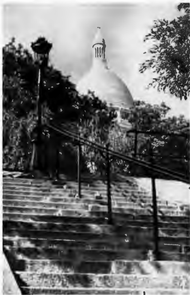
Купол церкви Сакре-Кёр