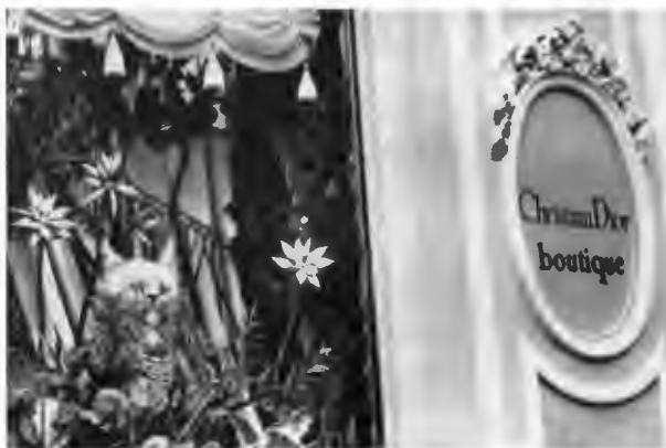
Магазин Кристиана Диора на улице Монтеня