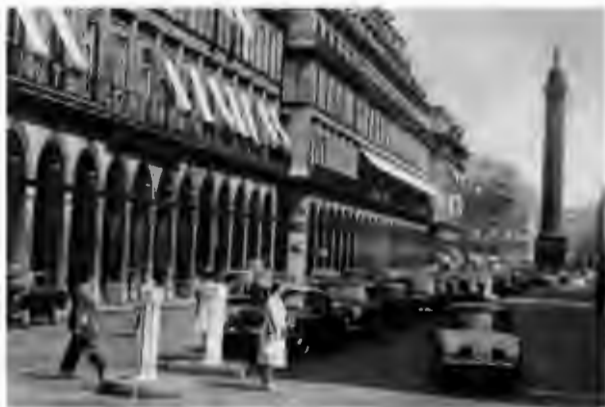
Улица Кастильоне и Вандомская площадь