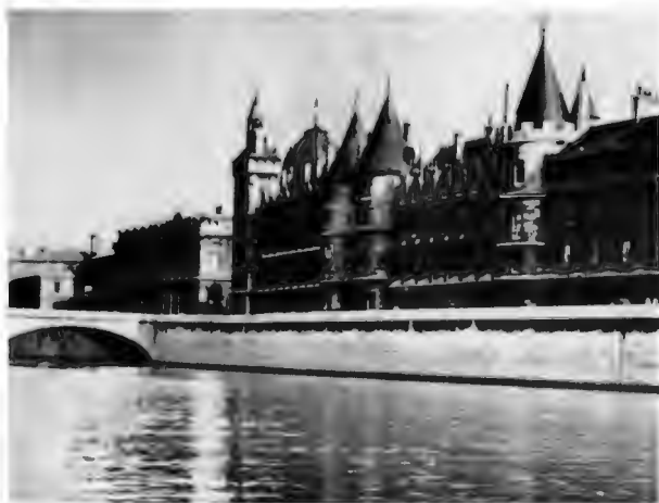
Консьержери, старинная парижская тюрьма