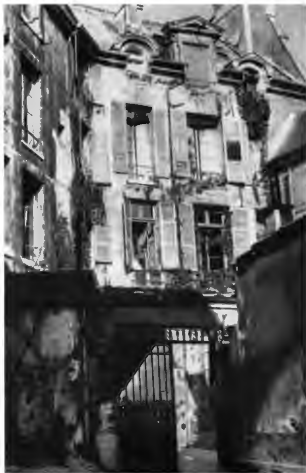
Отель Роан Генрих II выстроил для Дианы де Пуатье