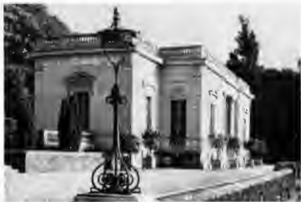
Маленький замок Багатель на фоне Булонского леса