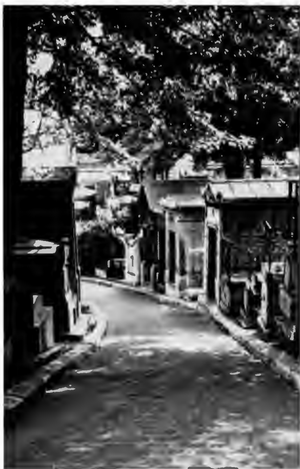
Аллея кладбища Пер-Лашез