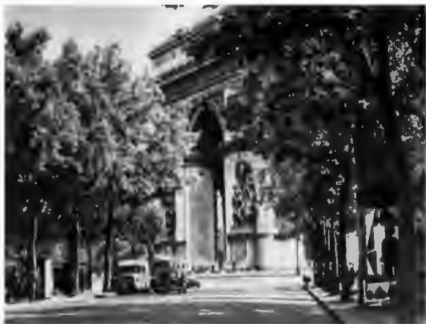
Триумфальная арка на площади Звезды