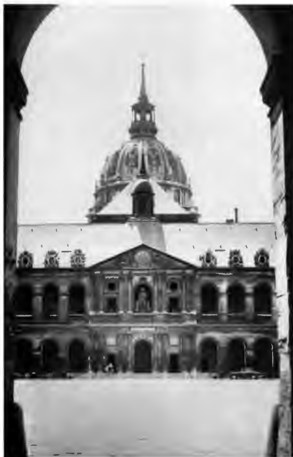
Вид на Дом Инвалидов