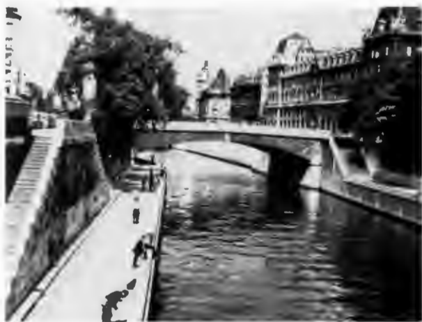
Малый мост соединяет Ситэ с левым берегом Сены