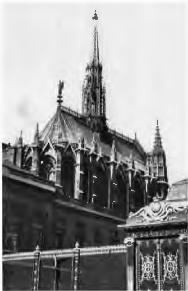
Изысканные линии часовни Сент-Шапель