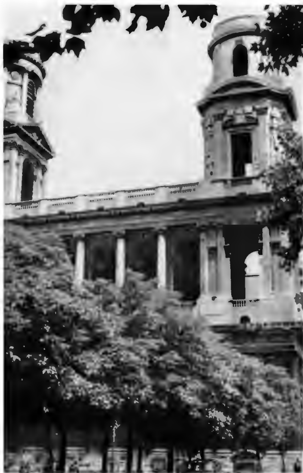
Башни церкви Сен-Сюльпис