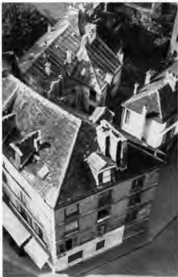
Улица на холме Сент-Женевьев