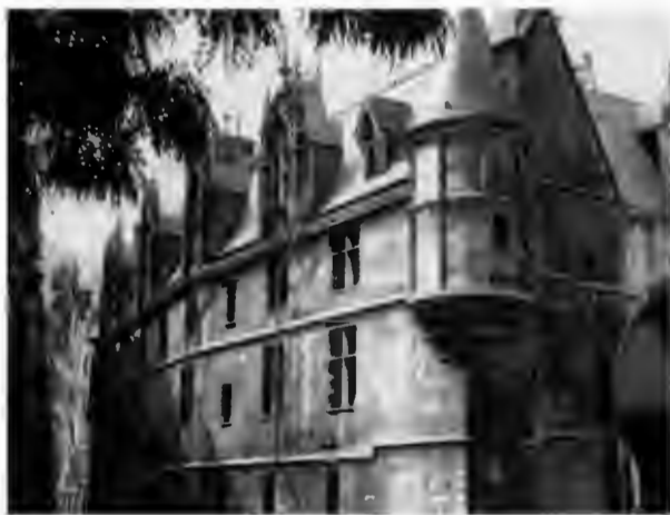
Отель Санс – памятник архитектуры XV века