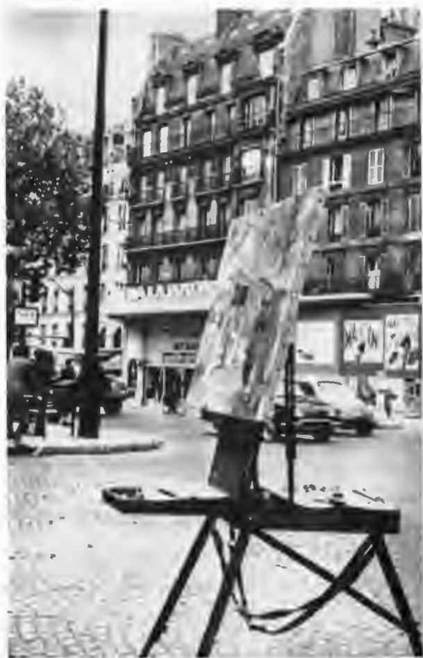
Монпарнас. Перекресток Вавен