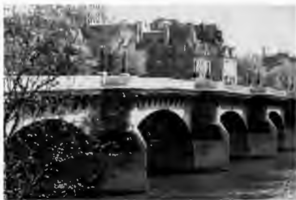
Новый мост, старейший мост в Париже