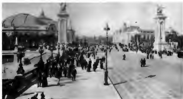
Всемирная выставка 1900 года. Вид на мост Александра III и авеню Николая II