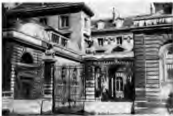
Коллеж де Франс