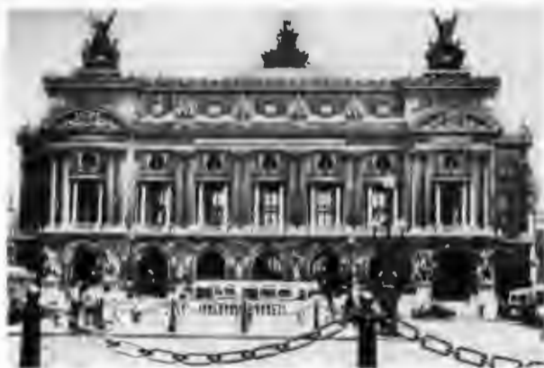
Гранд-Опера, Национальная Академия музыки и танца