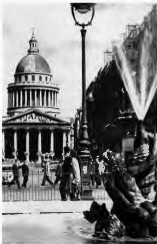
Вид на Пантеон из Люксембургского сада