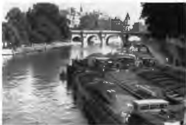
Новый мост и остров Ситэ