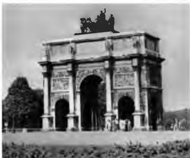
Триумфальная арка на площади Карусель