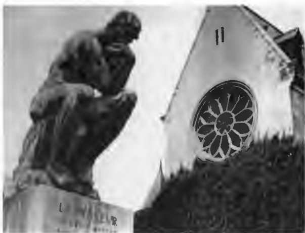
«Мыслитель» у отеля Бирон, ныне Музея Родена