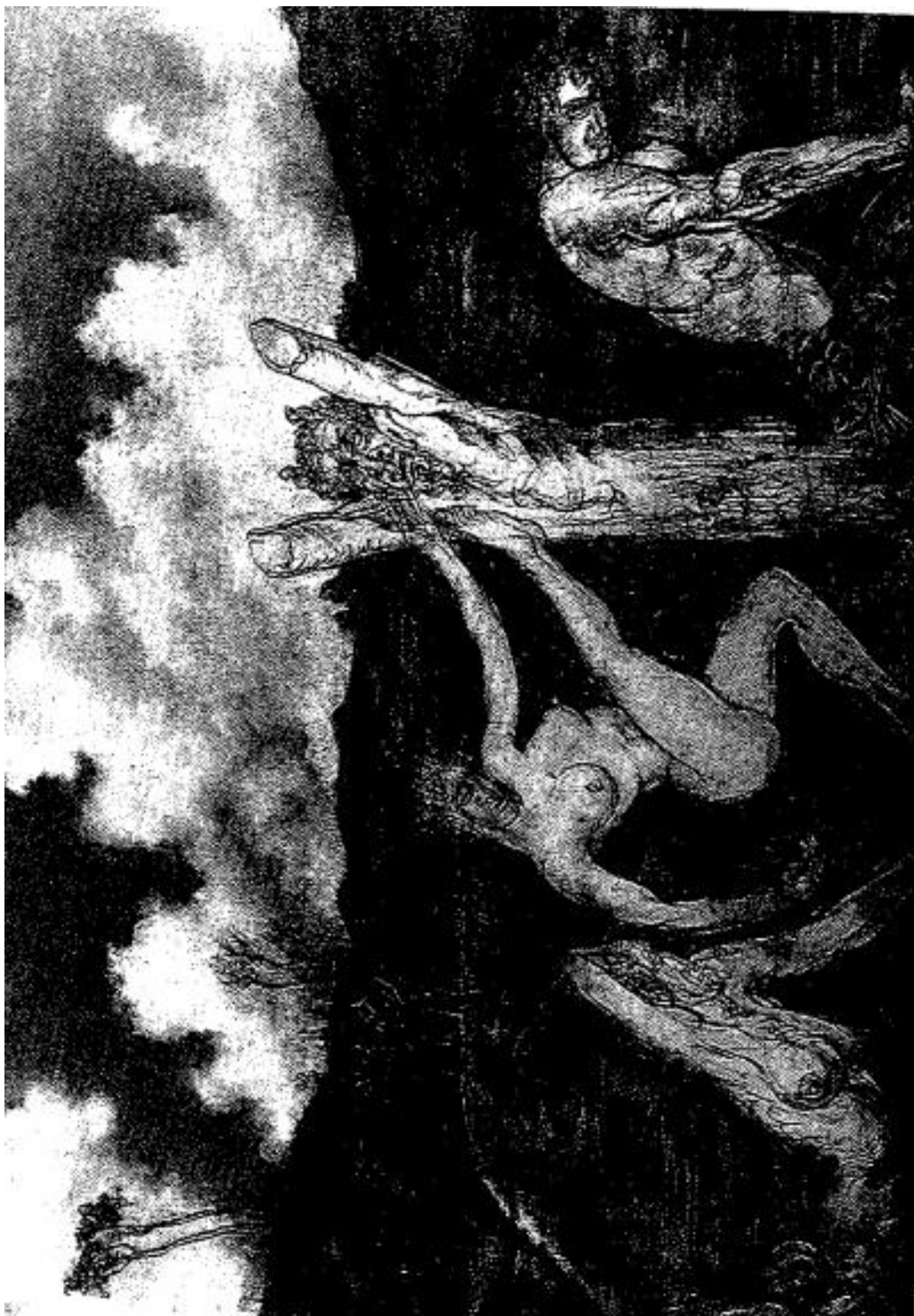
Пан Сатур, Остин Осман Спейр.